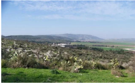
النغفنية: موقع القرية