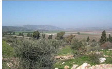
النغفنية: موقع القرية