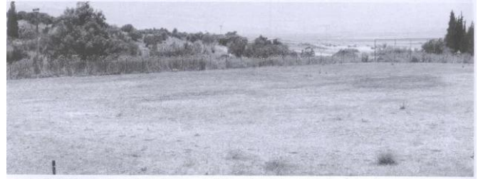
منظر لموقع القرية، وقد بات الآن - جريباً - ملعب كرة قدم - المشهد كما يبدو للناظر إليه من جهة الجنوب الشرقي (أيار/مايو ١٩٩٠) [النغفنية] النغفنية: جزء من مركز القرية المدمر حول لملعب كرة قدم، 1990.