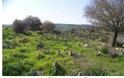
النغفنية: مقبره القرية