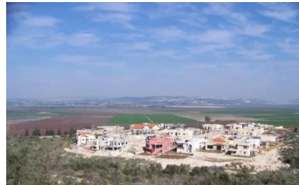
النغفنية: منظر من موقع القرية والمستوطنه المقامه على اراضيها