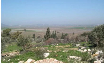
النغفنية: موقع القرية