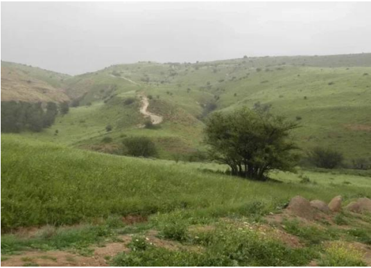
الطيرة الزعبية (المريج): من نواحي القرية