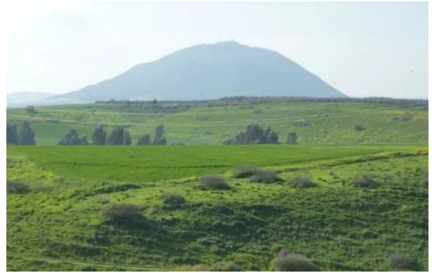
الطيرة الزعبية (المريج): الطيره بيسان