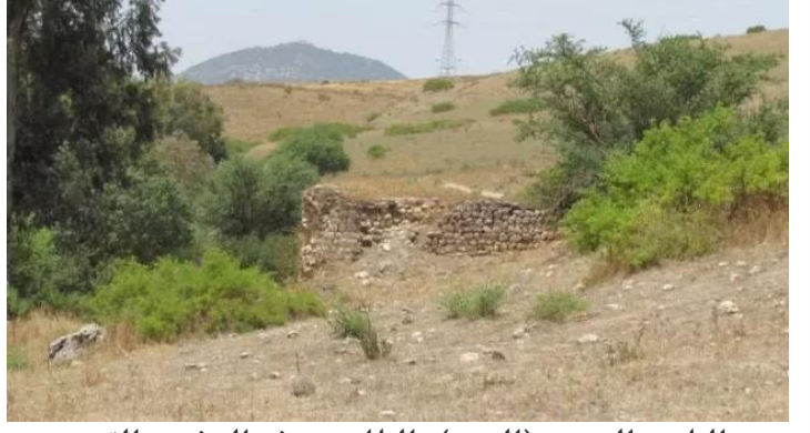
الطيرة الزعبية (المرج): الطاحونه شمال شرق القرية