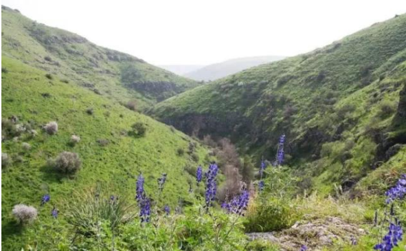
الطيرة الزعبية (المريج): وادي البيره شمال القرية