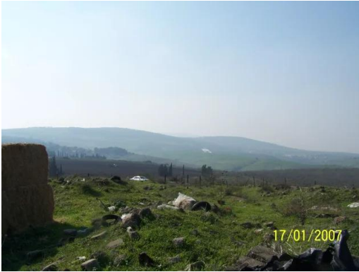
الطيرة الزعبية (المريج): منظر عام لطيرة بيسان