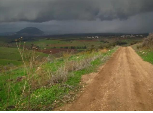
الطيرة الزعبية (المريج): قرية الطيره بيسان