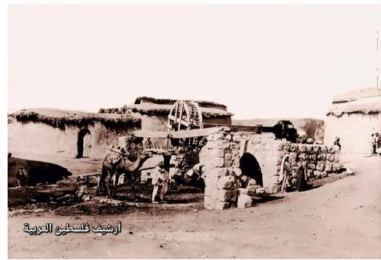
الطيرة الزعبية (المريج): الطيره الزعبية قبل النكبة