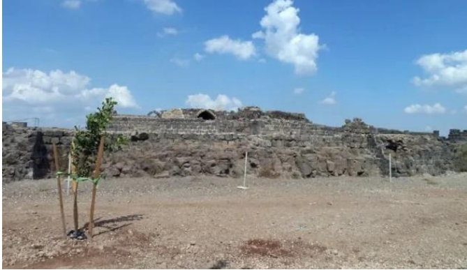
كوكب الهوا: اثار كوكب الهوا