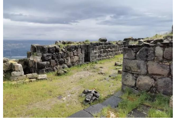
كوكب الهوا: جولة في قلعة كوكب الهوا المهجرة