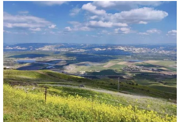
كوكب الهوا: نظرة نحو شرقي الاردن من قرية كوكب الهوا المهجرة