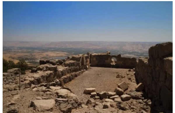
كوكب الهوا: اثار كوكب الهوا