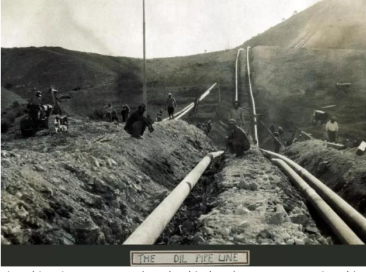
كوكب الهوا: تمديد خطوط البترول بين حيفا والعراق سنة 1933 - الموقع... كوكب الهواة فوق جسر الجامع