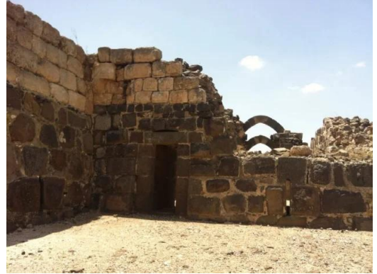
كوكب الهوا: من داخل القلعة