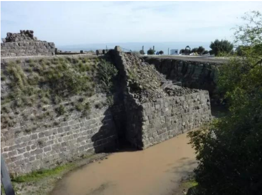
كوكب الهوا: من اسوار القلعه