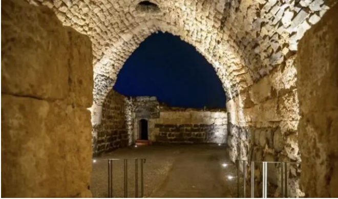
كوكب الهوا: جولة في قلعة كوكب الهوا المهجرة