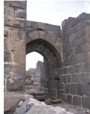
كوكب الهوا: المدخل الى القلعه