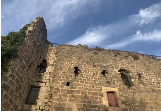
كوكب الهوا: جولة في قلعة كوكب الهوا المهجرة