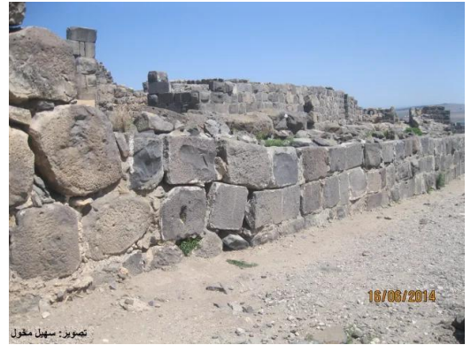
وكب الهوا: كوكب الهوا - القلعة يوم 16 حزيران 2014