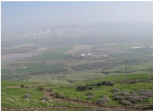
كوكب الهوا: كوكب الهوا