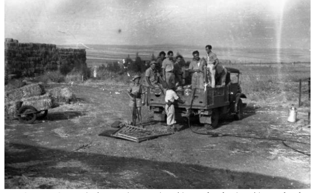
كوكب الهوا: كوكب الهوا يوم احتلالها 16.5.1948