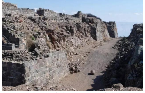
كوكب الهوا: اثار كوكب الهوا