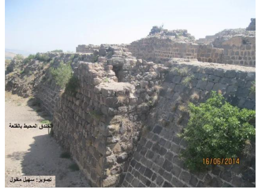
كوكب الهوا: كوكب الهوا - القلعة يوم 16 حزيران 2014