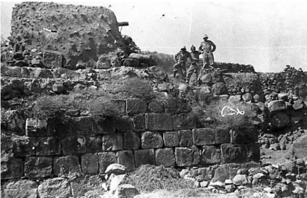
كوكب الهوا: كوكب الهوا يوم احتلالها 16.5.1948