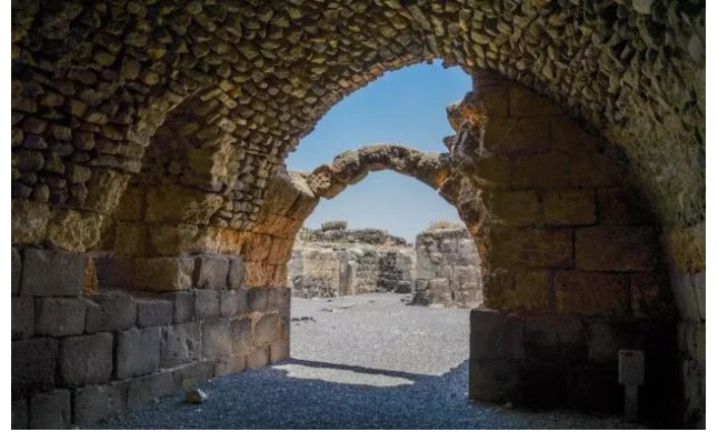
كوكب الهوا: جولة في قلعة كوكب الهوا المهجرة