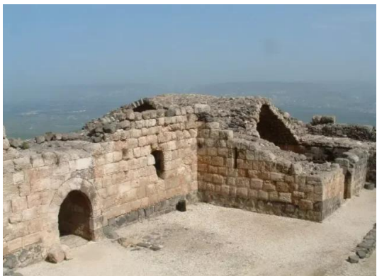
كوكب الهوا: كوكب الهوا