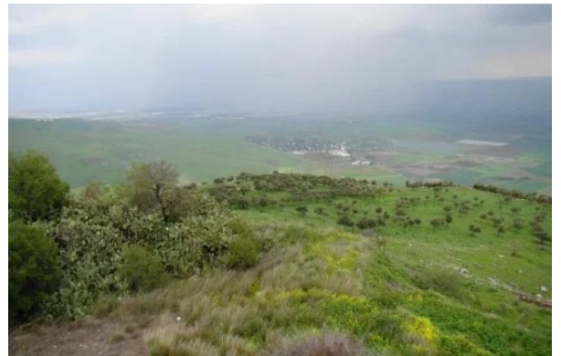
كوكب الهوا: موقع كوكب الهوا