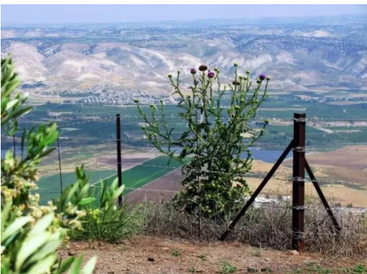
كوكب الهوا: منظر من موقع القرية باتجاه الاردن