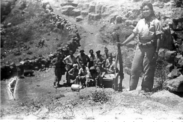
كوكب الهوا: كوكب الهوا يوم احتلالها 16.5.1948