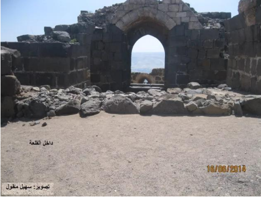
كوكب الهوا: كوكب الهوا - القلعة يوم 16 حزيران 2014