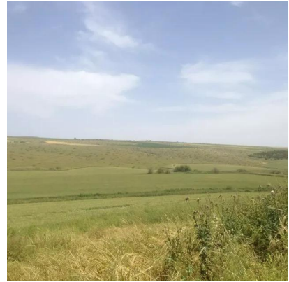
يبلى: سهل يبلى