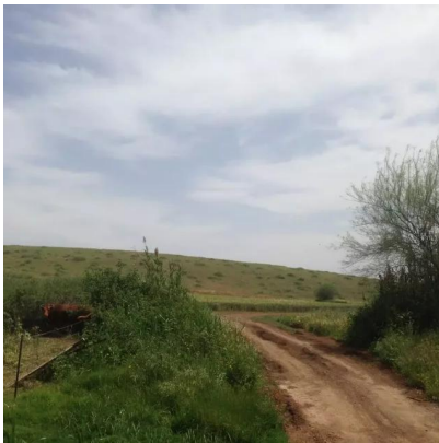
يبلى: منظر باتجاه الشرق