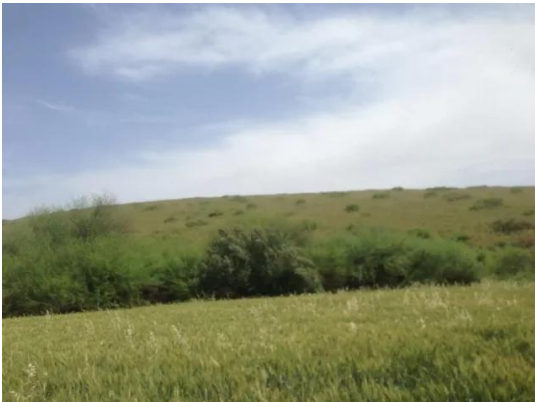
بلى: سفوحها الخضرا