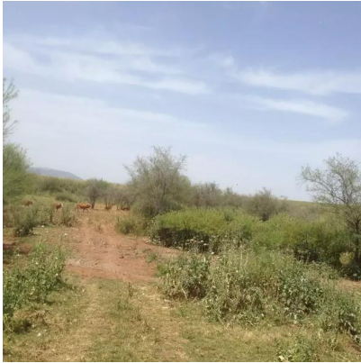
يبلى: منظر باتجاه الشرق