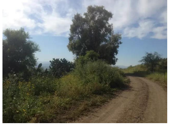
يبلى: منظر من يبلى