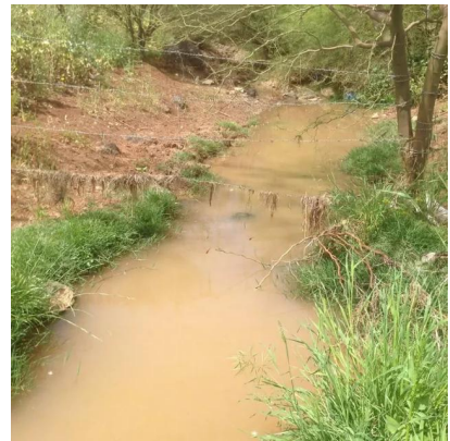
يبلى: واد يبلى