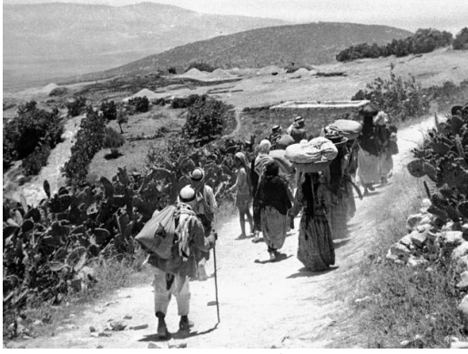
قومية: تهجير أهالي قرية قومية عام 1948،