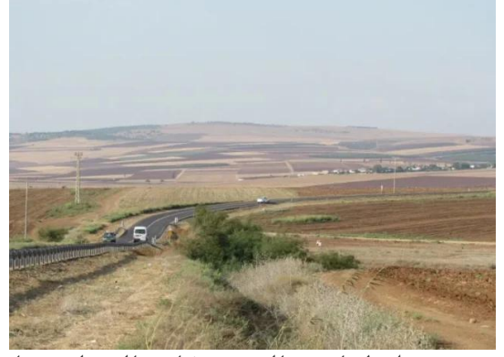
قومييه: منظر لاراضي القريه وشارع العفوله بيسان يمر من جانبها