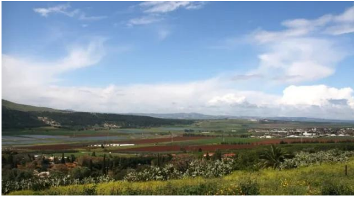
قومية: من موقع القرية