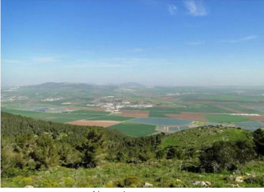
قومييه: من جانب القريه