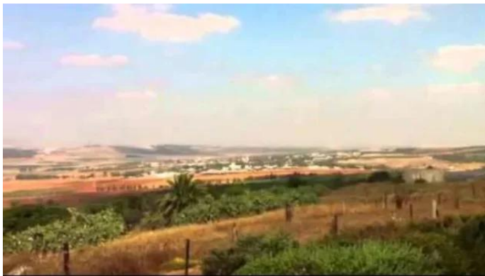
قومية: موقع القرية