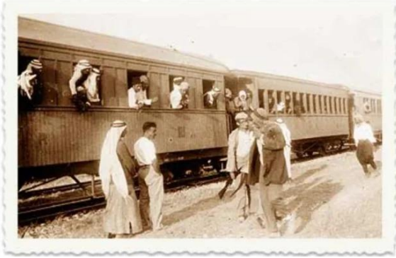
قومية: محطة قطار الحجاز بالقرب من قومية سنة 1926