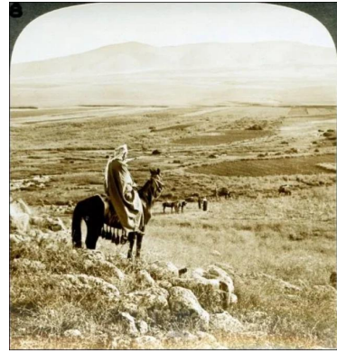
قومية: رجل علي ظهر حصان علي مشارف قرية قومية بلدة فلسطينية تقع إلى الشمال الغربي من قضاء بيسان ١٨٩٨