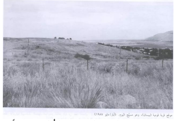
قومية: موقع القرية المدمرة والمُطهرة عرقياً، موقع قرية قومية (بيسان)، وهو مسج اليوم. (أبواب مايو ١٩٨٨)