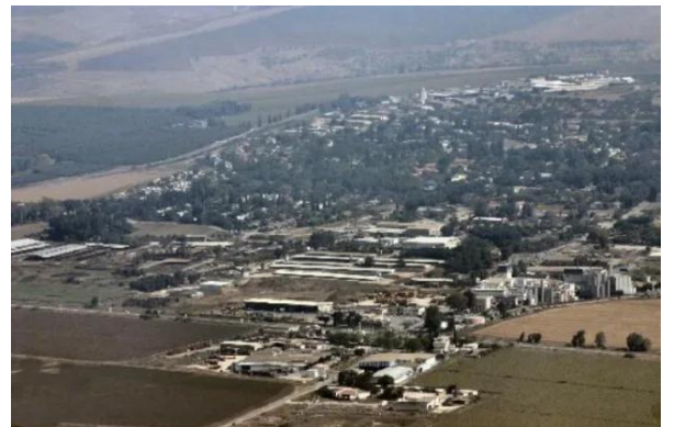
قومية: أراضي القرية والمستوطنه المقامه عليها