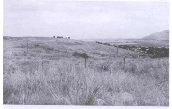
قومية: موقع القرية المدمرة والمُطهرة عرقياً، موقع قرية قومية (بيسان)، وهو مسج اليوم. (أبواب مايو ١٩٨٨)