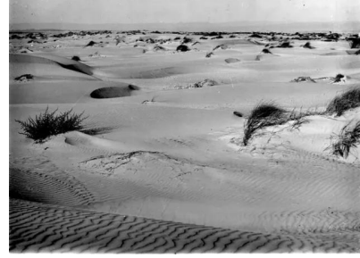
وادي الحوارث: التلال الرملية في منطة وادي الحوارث سنة 1930 م العديد منها منتشر حول النهر وعلى الشاطئ