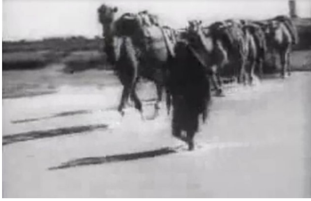
وادي الحوارث: قافلة جمال لنقل البطيخ بدايات القرن العشرين