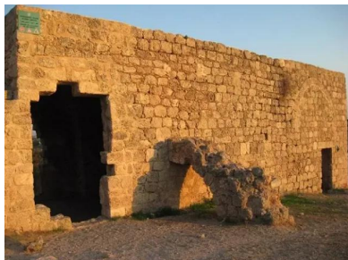
وادي الحوارث: خربة سمارة - سلسلة فوتوغرافيا خربة سمارة 13