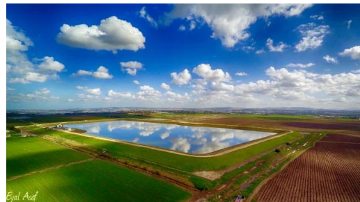
وادي الحوارث: ارض الملاحة اجمل مناطق واكبر خزان مياه في وادي الحوارث