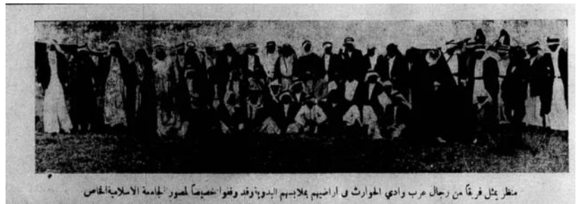
منظر يمثل فريقاً من رجال عرب وادي الحوارث في اراضيهم بملابسهم البدوية وقد وقفوا خصيصاً لصور الجامعة الاسلامية الخاص وادي الحوارث: منظر يمثل فريقاً من رجال عرب وادي الحوارث في أراضيهم بملابسهم البدوية

وادي الحوارث: فريق من نساء عرب وادي الحوارث أمام بيوت الشعر