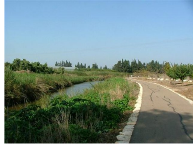
وادي الحوارث: وادي الإسكندرونة