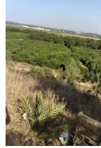
وادي الحوارث: وادي الحوارث القبلي - الجنوبي