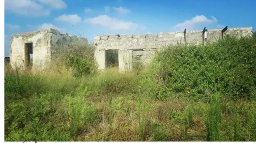
وادي الحوارث: مدرسة وادي الحوارث الشمالي المهجرة