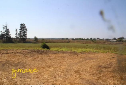
وادي الحوارث: قرب مدرسة وادي الحوارث