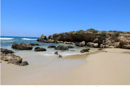
وادي الحوارث: شاطئ وادي الحوارث