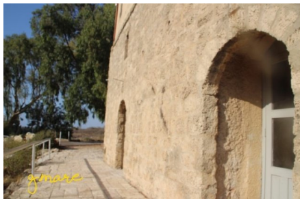
وادي الحوارث: جدران قصر التيان على اراضي وادي الحوارث