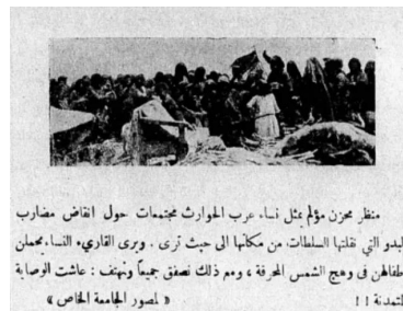
منظر يحزن مؤلم يمثل نساء عرب الحوارث مجتمعات حول انقاض مضارب البدو التي قلنها السلطات من مكانها الى حيث ترى . وبرى القاري، النساء، يجمان المفاطن في وهج الشمس الحارقة ، ومع ذلك نصفن جميعاً ونهتف : عاشت الوصاية للتندة !! «لصور الجامعة الخاص»

وادي الحوارث: قرية تل الشوك في بيسان والتي كانت مقترحة على عرب وادي الحوارث للانتقال إليها بعد اخلاءهم