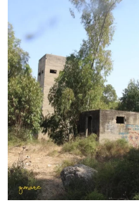
وادي الحوارث: بقايا من القلعة الانجليزية والتي كانت مركز امن من أجل حماية المفتصات القريبة من وادي الحوارث