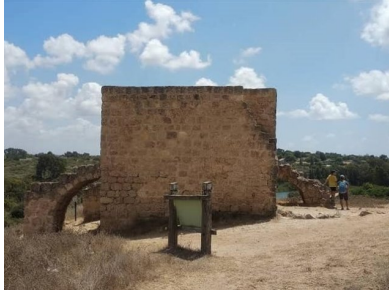
وادي الحوارث: عقد السمات خربة ابو سمارة تصوير جانبي