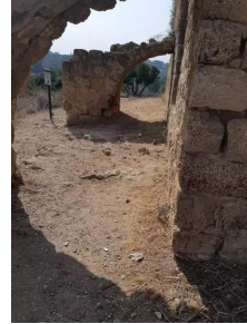
وادي الحوارث: عقد السمات خربة ابو سمارة تصوير جانبي