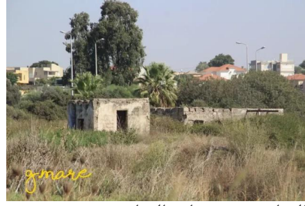
وادي الحوارث: مدرسة وادي الحوارث