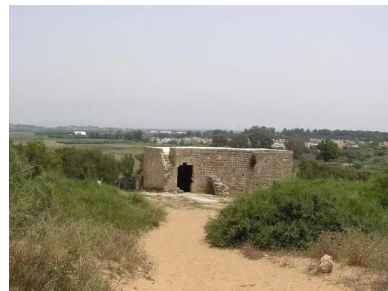
وادي الحوارث: خربة سمارة - سلسلة فوتوغرافيا خربة سمارة 12