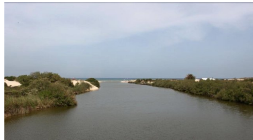
وادي الحوارث: نهر اسكندرونة ،، منظر ولا احلى