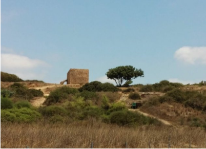
وادي الحوارث: خربه سماره