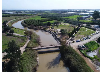
وادي الحوارث: عيون الحفيرة