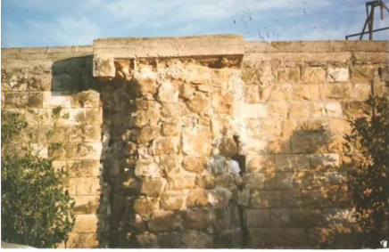
وادي الحوارث: مسجد وادي الحوارث من جهة المحراب قبل هدمه في عام 2000