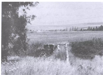
موقع القرية (أيار/مايو ١٩٩٠) [تل الشوك]

وادي الحوارث: قرية تل الشوك في بيسان والتي كانت مقترحة على عرب وادي الحوارث للانتقال إليها بعد اخلاءهم