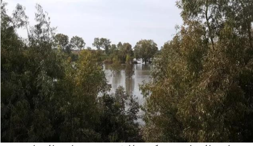
وادي الحوارث: بركة عطا في حوض وادي الحوارث