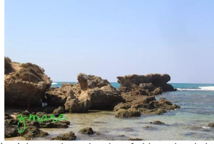
وادي الحوارث: ميناء ابو زابورة ( اسكندر ابو زابورة تاجر ومقاول نقل و تجارة البطيخ وتصديرها بالقرن التاسع عشر)