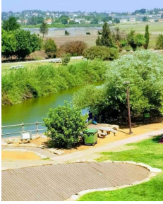
وادي الحوارث: من جماليات وادي الحوارث مسير نهر اسكندرونة