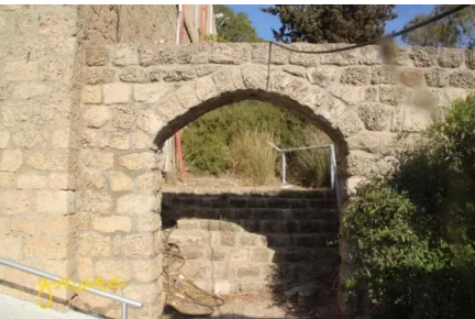
وادي الحوارث: من داخل قصر التيان على اراضي وادي الحوارث