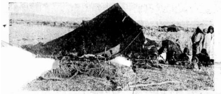
فريق من نساء عرب وادي الحوارث والراهن الى جانب بيوت الشعر . وهذه البيوت ازيات كلها بلا استثناء «لصور الجامعة الخاص»

وادي الحوارث: جريدة فلسطين - الخميس 13 كانون الأول 1934 محاسب الوكالة اليهودية عشرات الالوف من الجنيهاً تنفق على استعمار وادي الحوارث