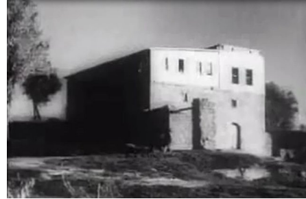
وادي الحوارث: عمارة التيان - صورة قديمة جدا