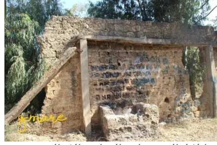
وادي الحوارث: اطلال البيوت وادي الحوارث الشمالي