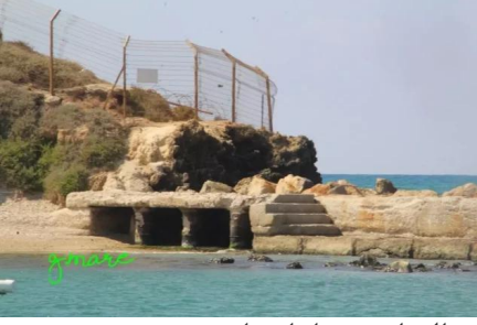
وادي الحوارث: ميناء ابو زابورة