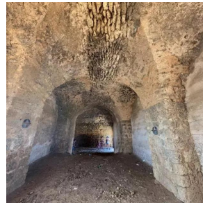
وادي الحوارث: من داخل غرف عقد السمات _ خربة سمارة