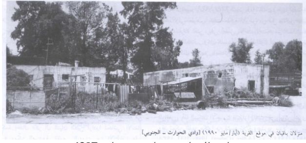
وادي الحوارث: بيتان مغتصبان. 1987