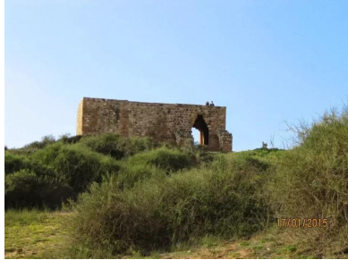
وادي الحوارث: منظر عام لخرية سمارة يوم 17 كانون الثاني 2015