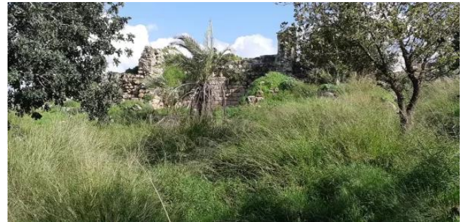
قاقون: زيارة بين انقاض قرية قاقون المهجرة