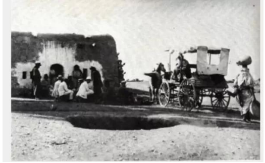
قاقون: قاقون قبل النكبة