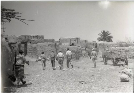
قاقون: صور نادرة لقرية قاقون يوم احتلالها وتهجير اهله