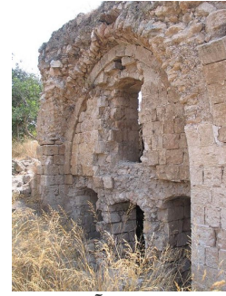
قاقون: سلسلة آثار قاقون