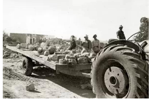
قاقون: سرقت الحجارة من بيوت القرية لبناء بيوت وشوارع المستوطنه