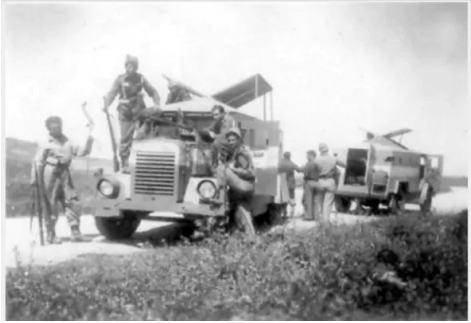
قاقون: العصابات الصهيونية تهاجم قرية قاقون