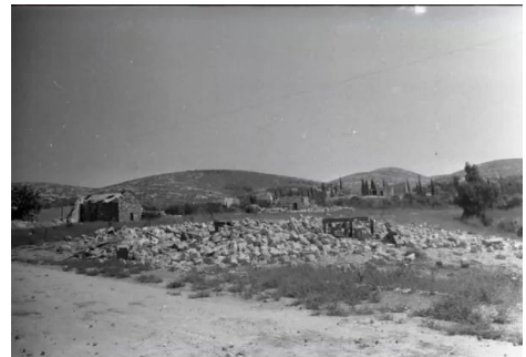
قاقون: صور نادرة لقرية قاقون يوم احتلالها وتهجير اهله