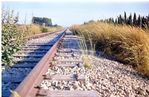
قاقون : سكة القطار