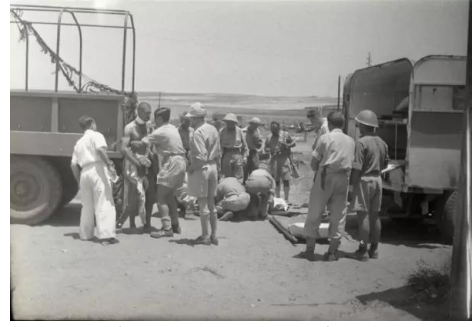
قاقون: صور نادرة لقرية قاقون يوم احتلالها وتهجير اهله