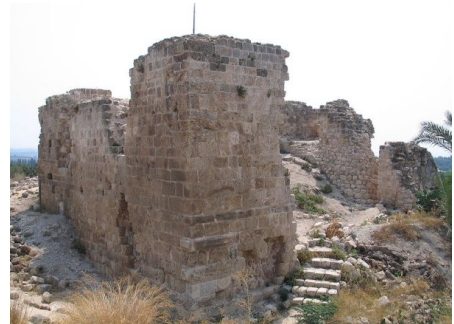
قاقون: سلسلة آثار قاقون