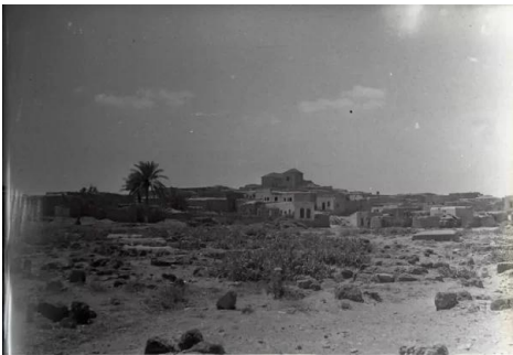
قاقون: صور نادرة لقرية قاقون يوم احتلالها وتهجير اهله