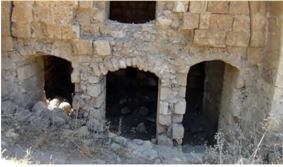
قاقون: بيوت قاقون