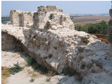
قاقون: سلسلة آثار قاقون