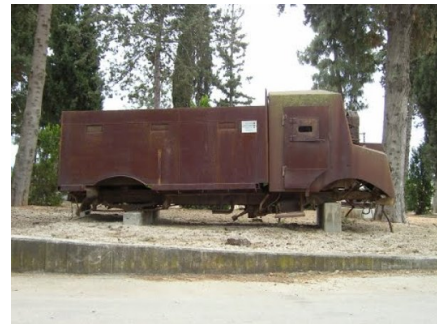
قاقون: سلسلة آثار قاقون