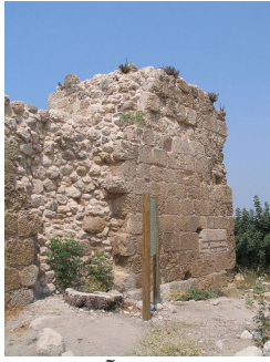
قاقون: سلسلة آثار قاقون