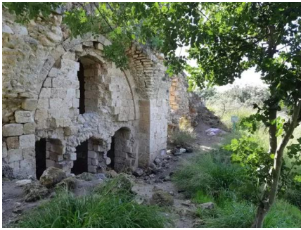
قاقون: زيارة لقرية قاقون