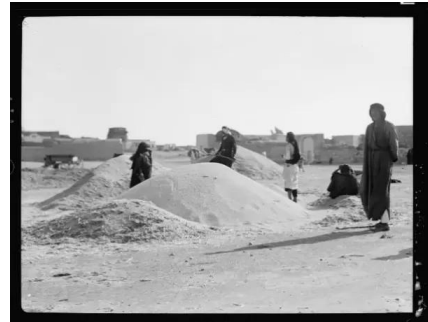
قاقون: بيار قاقون سنة 1940