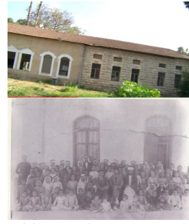
مدرسة قافون قبل وبعد النكبة