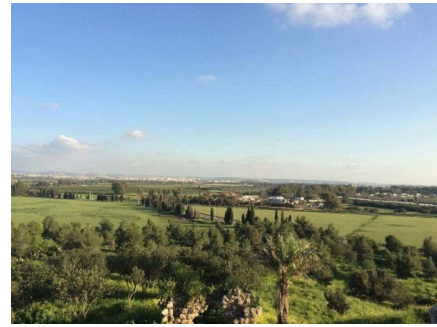
قاقون: اراضي قاقون