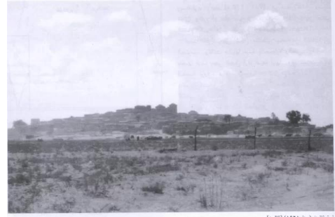
قاقون : قرية قاقون المهجرة قضاء طولكرم