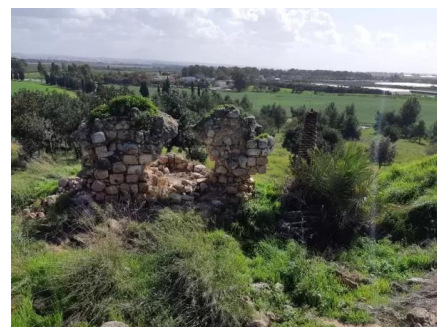
قاقون: زيارة بين انقاض قرية قاقون المهجرة