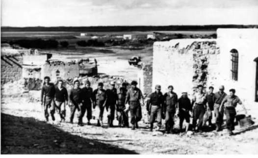
قاقون: قاقون بعد احتلالها من قبل العصابات الصهيونية