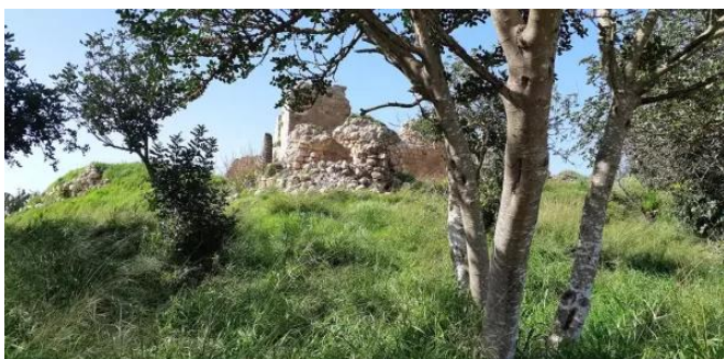
قاقون: زيارة بين انقاض قرية قاقون المهجرة