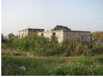
قاقون: محطة قاقون