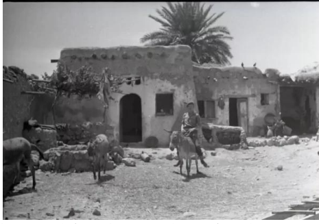
قاقون: صور نادرة لقرية قاقون يوم احتلالها وتهجير اهله