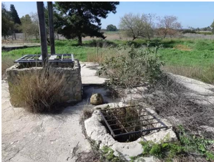
قاقون: زيارة بين انقاض قرية قاقون المهجرة