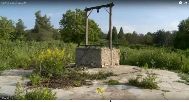
قافون: أبار قافون الشهيرة