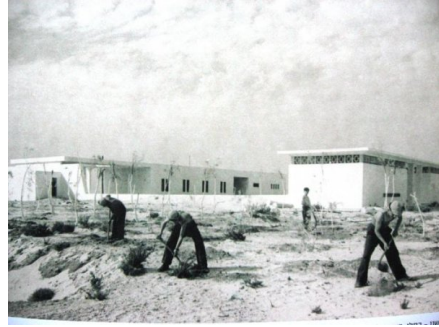
أم خالد: المفتصبون في أم خالد - بعد الاحتلال