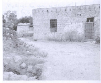
منزل من منازل القرية يستعمله الإسرائيليون اليوم مستودعاً (سنة ١٩٨٧) [أم خالد]