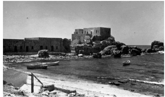
أم خالد: أطلال أم خالد تغفو قرب البحر