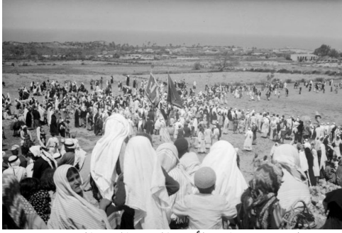
أم خالد: منظر قديم ونادر لأحد الاحتفالات الموسمية في القرية عام 1918