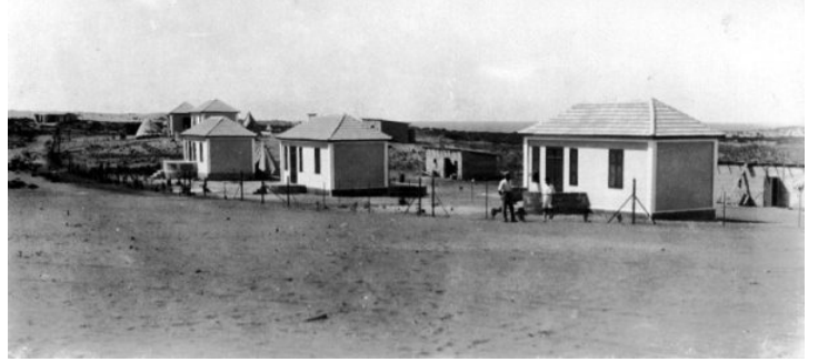
أم خالد: بدايات الاستيطان الاسرائيلي 1930 في البلدة