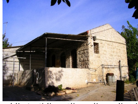
ام خالد: من البيوت القديمة الباقية في البلدة