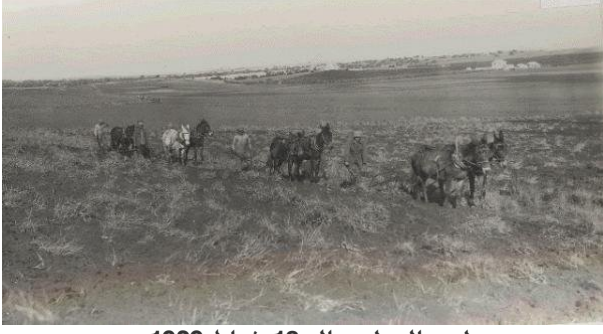
أم خالد: أم خالد 18 شباط 1929 م