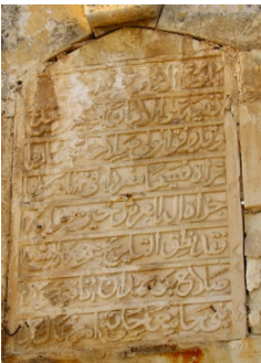
أم خالد: لوحة كانت على حائط المسجد