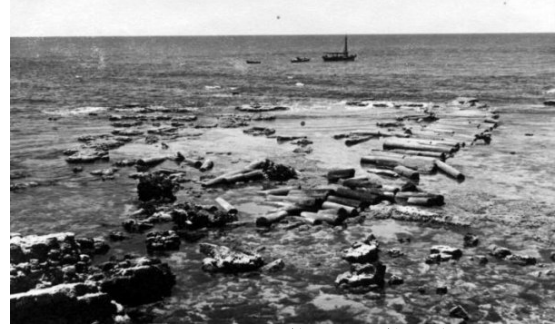
أم خالد: هدوء البحر - صور قديمة