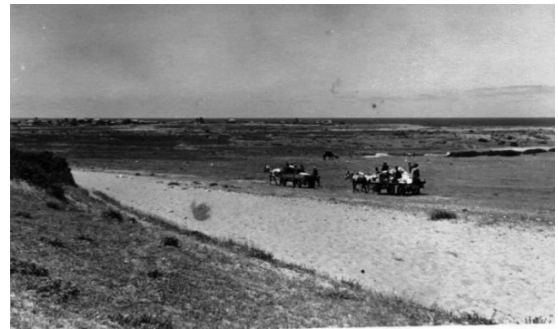
أم خالد: صورة قديمة جداً من أم خالد