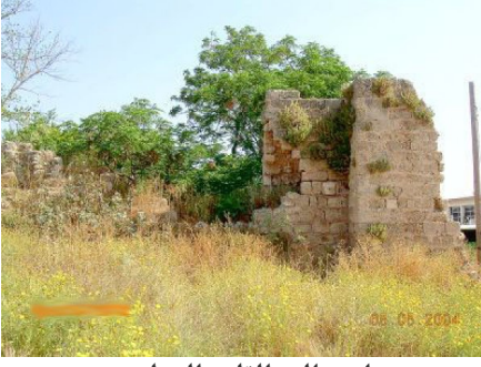
ام خالد: القلعة الصليبية