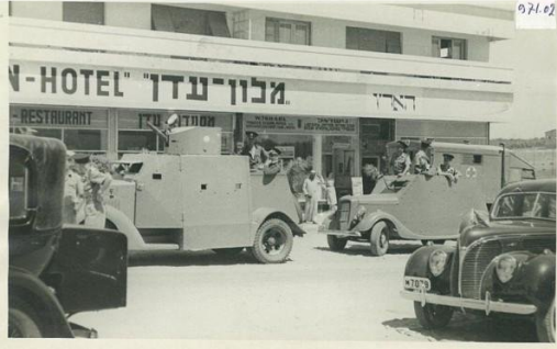
أم خالد: قوات من جيش المفتصبين لأم خالد أمام مبنى أقيم عليه فندق سمي فندق عدن