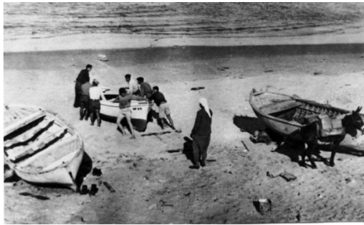
أم خالد: صورة قديمة للقوارب على البحر