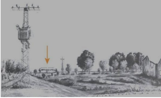
أم خالد: صورة في أم خالد بعد الاحتلال