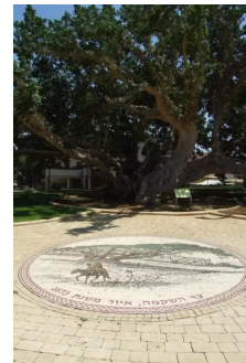
أم خالد: شجرة الجميز ويظهر فسيفساء فس أسفل الصورة تخليداً لهذه الشجرة