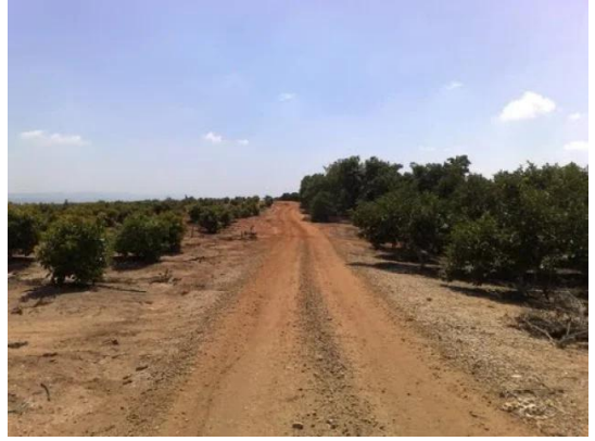
خربة بيت ليد: الحقول حول خربة بيت ليد وكفار يونا