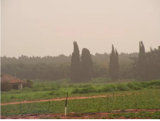
خربة بيت ليد: الحقول حول خربة بيت ليد وكفار يونا