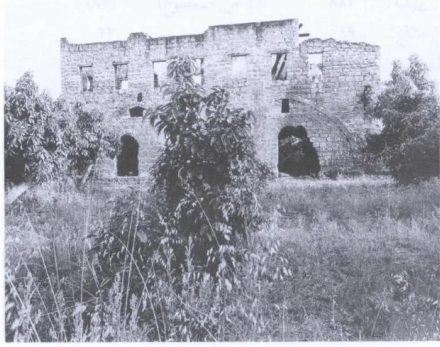
الواجهة الشمالية لمotel كبير من منازل القرية (حزيران/يونيو ١٩٩٠) [بيارة حنون]