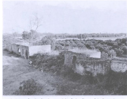
مجموعة من المنازل في الجهة الشرقية من موقع القرية. المشهد كما يبدو للناظر من الغرب إلى الشرق (حزيران/يونيو ١٩٩٠) [بيارة حنون]