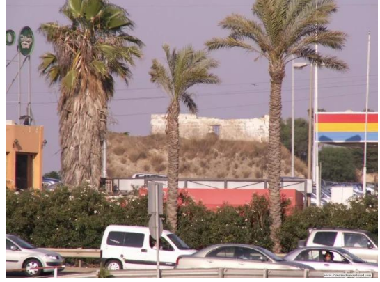
إجليل القبلية: بيت ابو سنيينة الموجود بالقرب من تقاطع جليلوت.