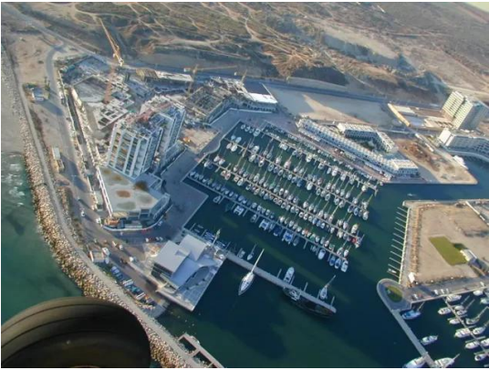
إجليل القبلية: صورة من الجو لفندق Herzelia Marina (مارينا هرتسيليا) ، وهو محاذي تماماً لـ اجليل الشمالية