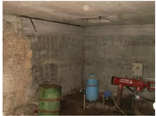
إجليل القبلية: مبنى لاحدى آبار القرية