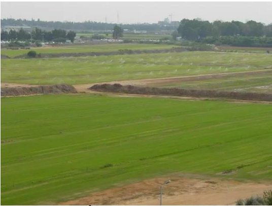
إجليل القبلية: صورة لبعض أراضي اجليل