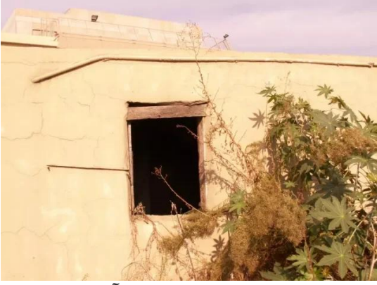
إجليل القبلية: مبنى لاحدى آبار القرية