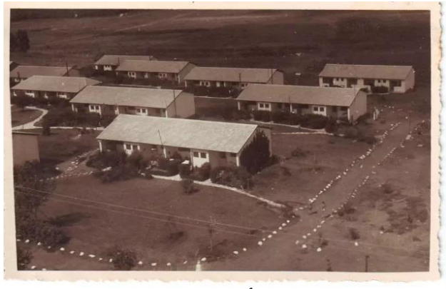
إجليل القبلية: كيف بدأت مستعمرة هرتسيليا شمال اجليل ؟؟؟؟