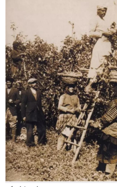
فجة: قرية فجه قبل النكبه