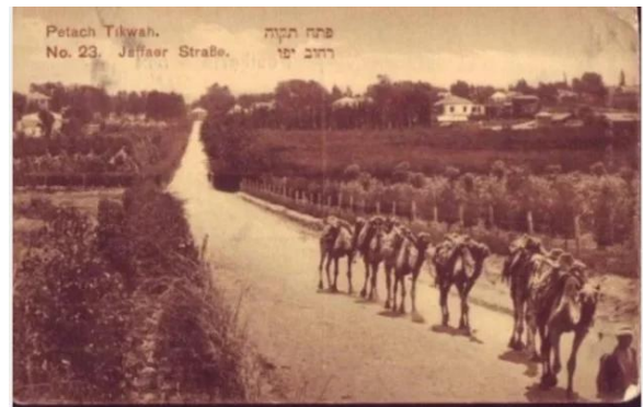
فجّة: قرية فجّه قبل النكبه