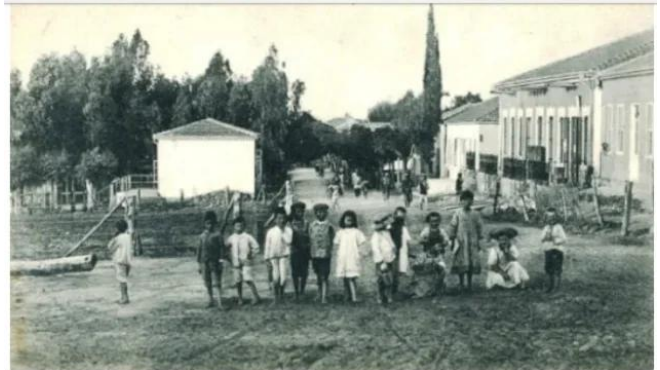
فجّة: فجّه قبل النكبه