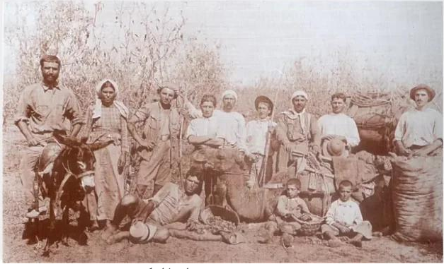
فجة: قرية فجه قبل النكبه