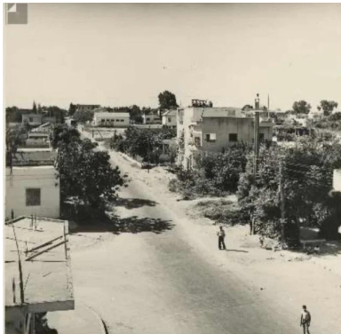
فجّة: قرية فجّه قبل النكبه