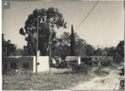
فجّة: قرية فجّه قبل النكبه