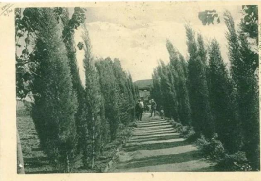
فجّة: قرية فجّه قبل النكبه