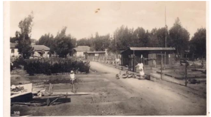
فجّة: قرية فجّه قبل النكبه