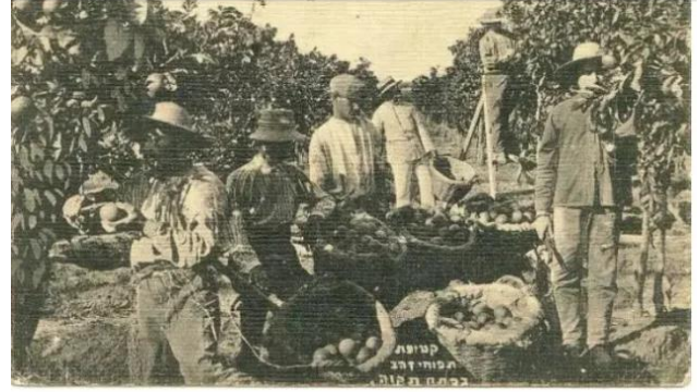
فجة: قرية فجه قبل النكبه