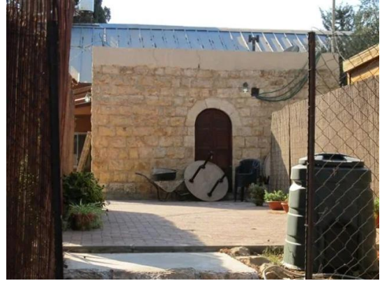
قرية رنتية المهجرة