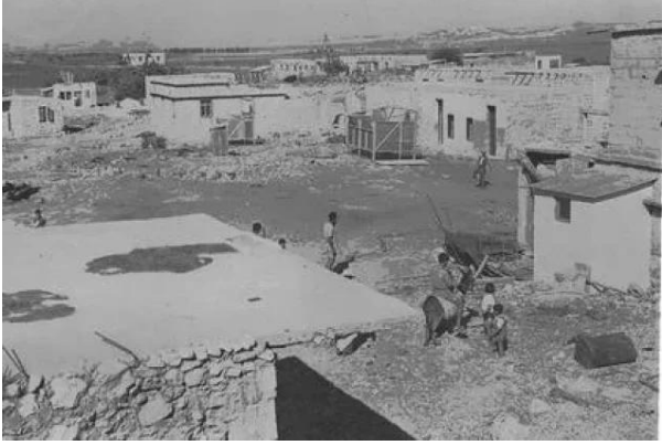
رنتية: منظر نادر في القرية بعد إحتلالها والمغتصبين الصهاينة فيها #3، 1949.