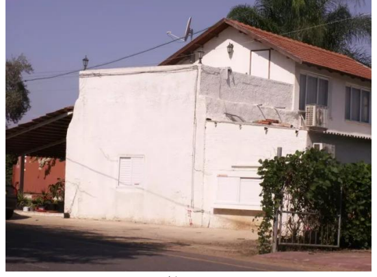
قرية رنتية المهجرة