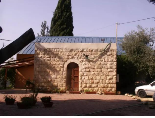
قرية رنتية المهجرة