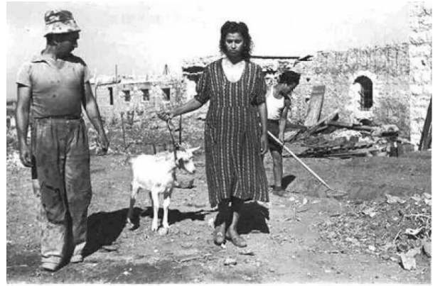
رنتية: منظر نادر في القرية بعد إحتلالها والمغتصبين الصهاينة فيها، 1949.