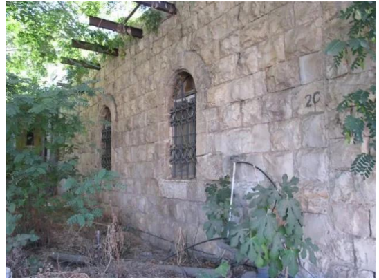
قرية رنتية المهجرة