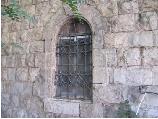
قرية رنتية المهجرة