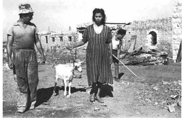
رنتية: منظر نادر في القرية بعد إحتلالها والمغتصبين الصهاينة فيها، 1949.