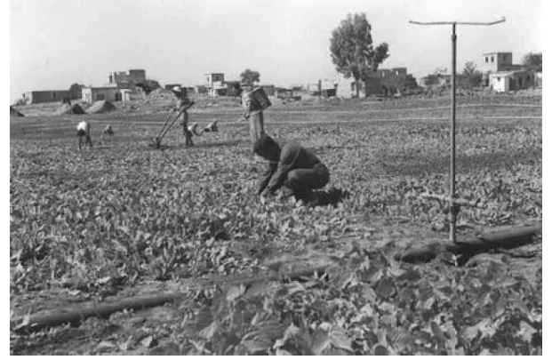
رنتية: منظر نادر في القرية بعد إحتلالها والمغتصبين الصهاينة فيها #3، 1949.