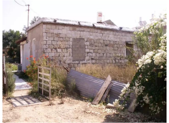
رنتية: احدى بيوت القرية المغتصبة