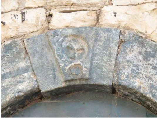
قرية رنتية المهجرة