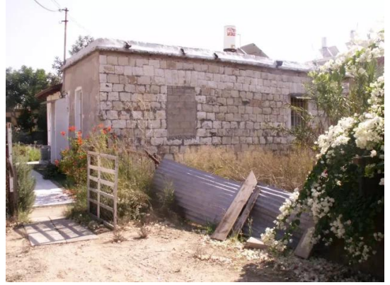
رنتية: احدى بيوت القرية المغتصبة