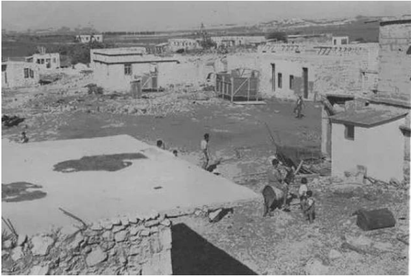
رنتية: منظر نادر في القرية بعد إحتلالها والمغتصبين الصهاينة فيها #3، 1949.