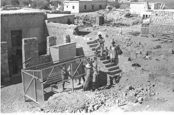
رنتية: منظر نادر في القرية بعد إحتلالها والمغتصبين الصهاينة فيها، 1949.