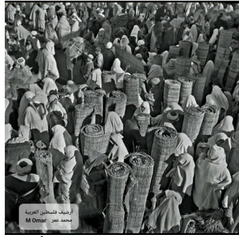
نساء فلسطين العرب محمد عمر M Omar (Al-'Abbasiyya (Yahudiyya