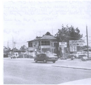
أحد منازل القرية، وقد بات الآن مكتباً لشركة تأمين إسرائيلية (سنة ١٩٤٠) (العيسية)