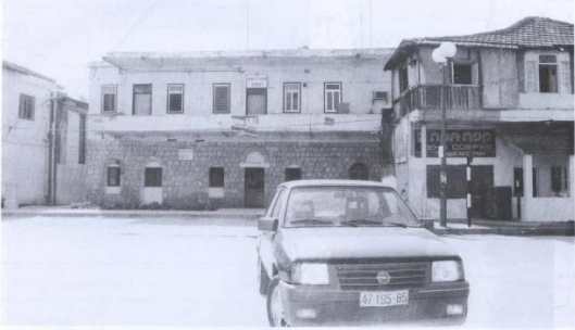
بنيان من أحياء القرية: البناء القاتم إلى اليمين بات الآن مهوى إسرائيلياً (بحسب ما يتبين من اللوحة التي كتب عليها ما معناه 'مهوى هير'). أما البناء القاتم إلى اليسار فهو مقر مكاتب بلدية مستعمرة يهود إسرائيل (البنسان) (أبريل ١٩٤٨) (العيسية)