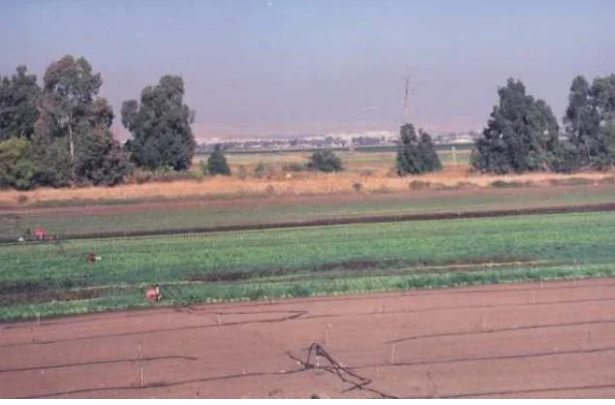
كفرعانة: المكان الذي كان مقام النبي مالك في القرية.