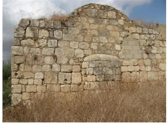
قرية كفر عانة المهجرة