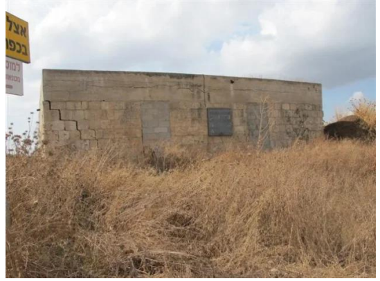
قرية كفر عانة المهجرة