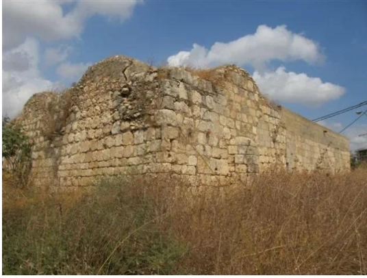
قرية كفر عانة المهجرة