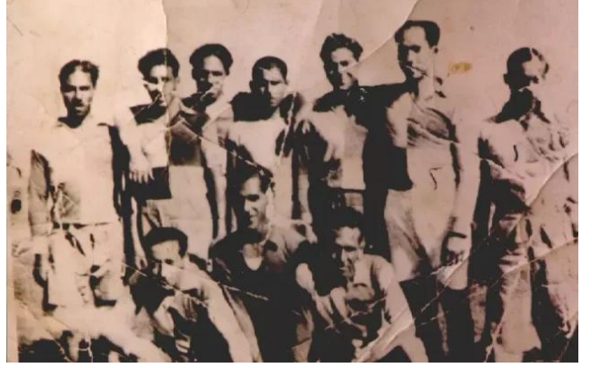
قريق كرة القدم في كفر عانة