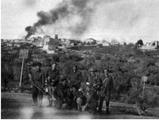
ساريس: صورة نادرة للكتيبة الصهيونية وهم يدمرون قرية ساريس المهجرة, 1948