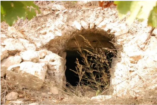
قرية ساريس المهجرة قضاء القدس