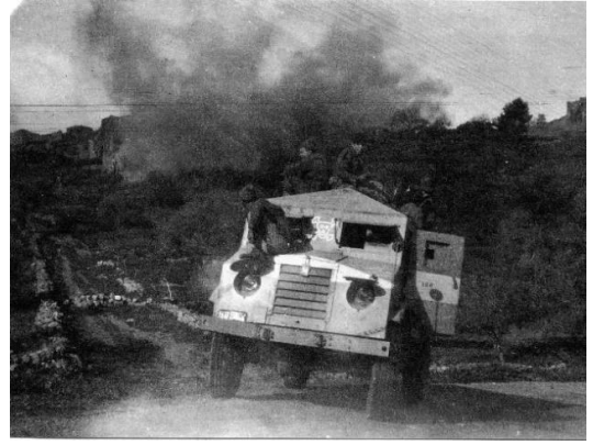
ساريس: صورة نادرة للكتيبة الصهيونية وهم يدمرون قرية ساريس المهجرة, 1948