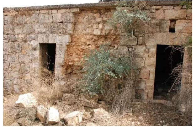
قرية ساريس المهجرة قضاء القدس