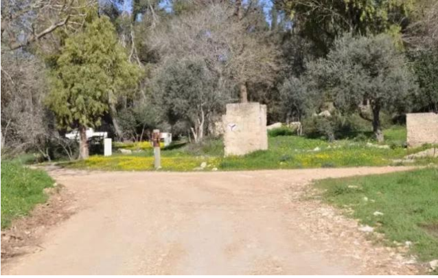
قرية ساريس المهجرة قضاء القدس