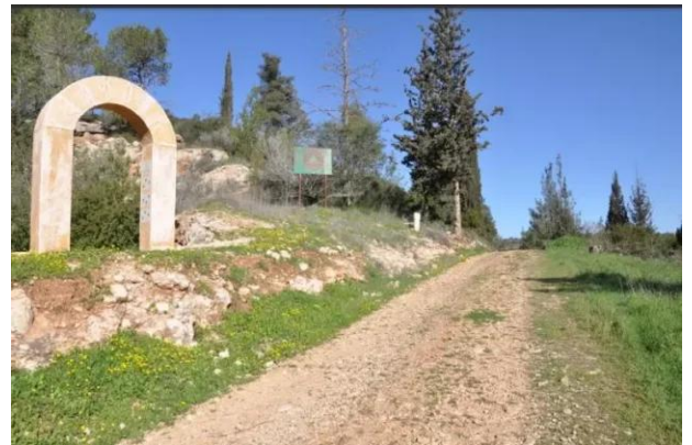
قرية ساريس المهجرة قضاء القدس