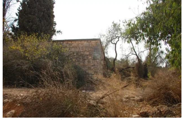
قرية ساريس المهجرة قضاء القدس