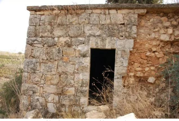
قرية ساريس المهجرة قضاء القدس