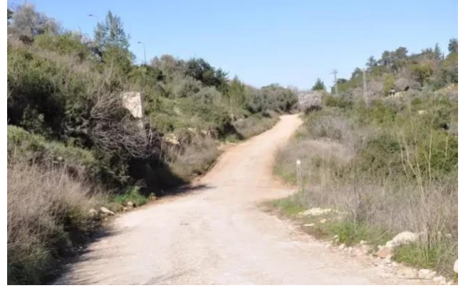
قرية ساريس المهجرة قضاء القدس