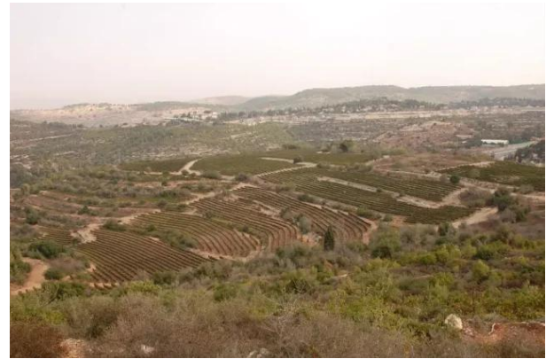
قرية ساريس المهجرة قضاء القدس