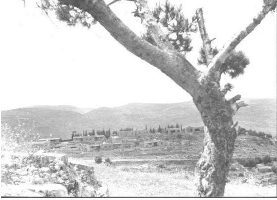
ساريس: صورة انادرة اخذت بعد النكبة