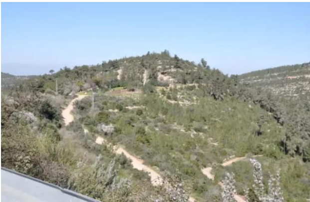
قرية ساريس المهجرة قضاء القدس