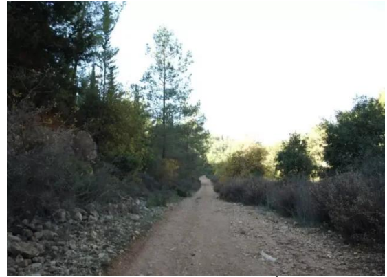
بيت أم الميس: بيت أم الميس