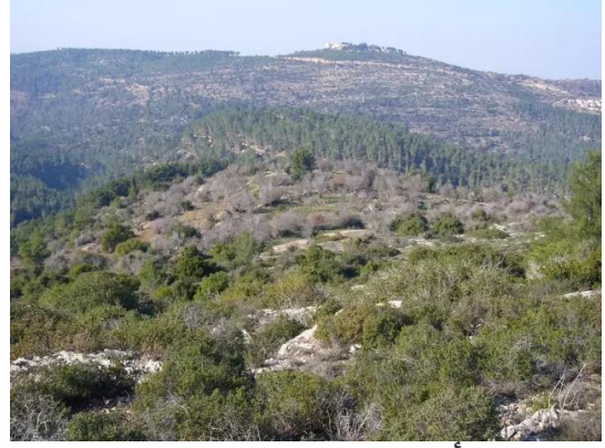
بيت أم الميس: الاراضي المحيطة