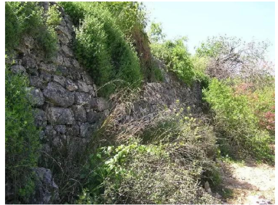
الجورة: الجدران الاستنادية في القرية المدمرة. خريف-2005