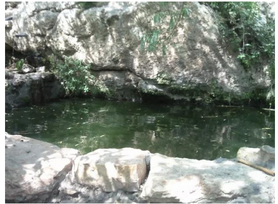
الجورة: عين في بلدة الجورة