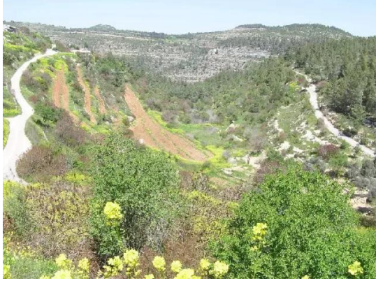
الجورة: الطبيعة الخلابة للقرية. عين الجورة موجودة في المنطقة السفلى اليمنى من الوادي. خريف-2004