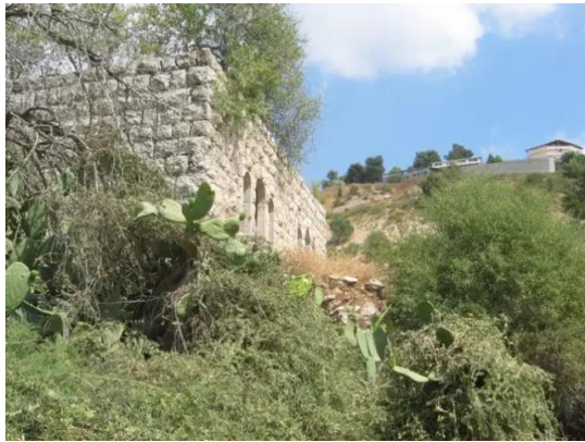
الجورة: إحدى بيوت القرية التي نجت من هجمة التدمير الصهيوني، وفي أعلى الصورة نرى المغتصبة الصهيونية. خريف-2004