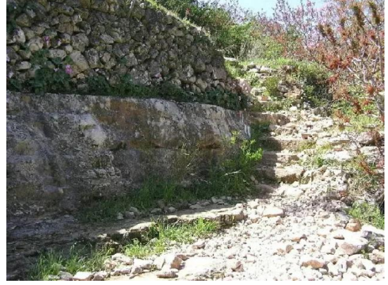
الجورة: أدراج حجرية بالقرب من عين الجورة. خريف-2004