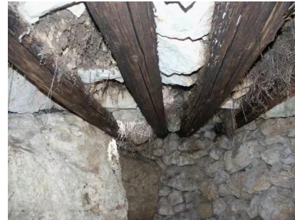
خرية اللوز: في داخل احدى البيوت المجودة بالقرب من وادي الصرار