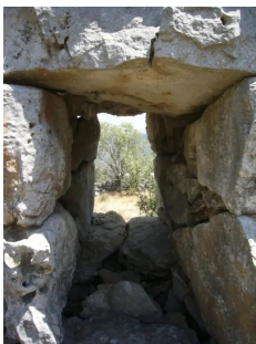
خربة اللوز: شبك لاحد بيوت البلد القديمه