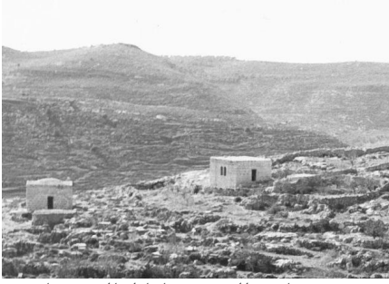
خربة اللوز: صورة نادرة للقرية في اوائل الخمسينات بعد التطير العرقي وقبل تدمير القرية