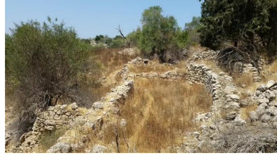
خرية اللوز: اثار من دور البلده القديمه