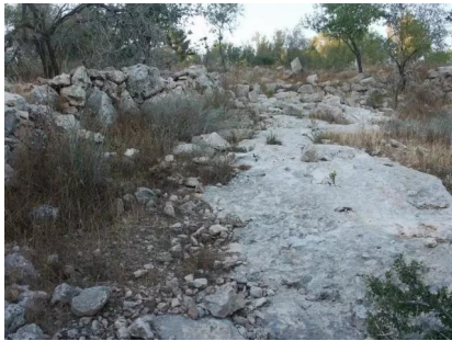
خربة اللوز: الطريق المؤدي لدمار القرية