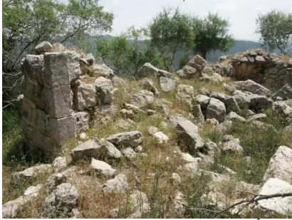
خرية اللوز: أطلال بيوت القرية المدمرة واضحة في الصورة