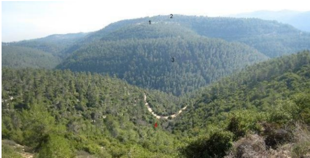
خرية اللوز: اراضي خرية اللوز من الغرب