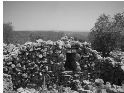
خربة اللوز: أطلال احد بيوت القرية المدمره