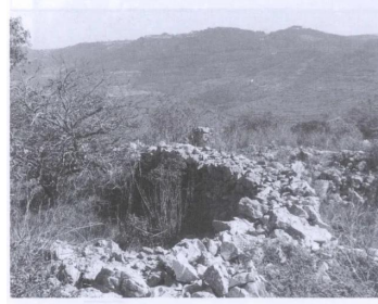
أبقاض في موقع القرية (سنة ١٩٨٦) [خربة اللوز]