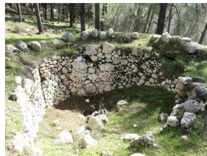
خربة اللوز: خربة اللوز - عشرات الامتار الى الجنوب من سلميه