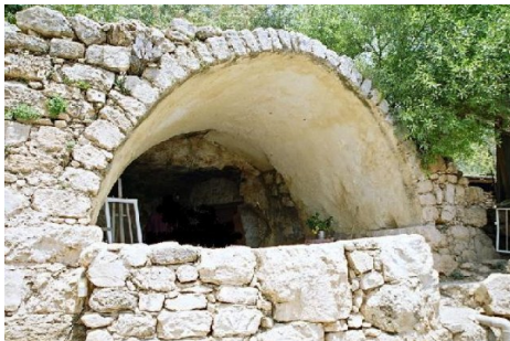
خرية اللوز: مقام الشيخ البخيتاري شرق خربه اللوز