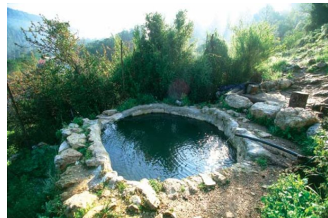
خرية اللوز: عين القف في اقصى الجنوب الغربي لاراضي البلد في الجهة الجنوبيه لواد سلميه