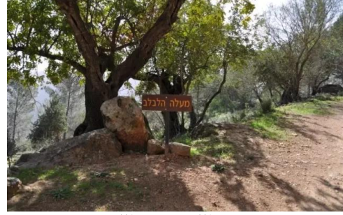
خرية اللوز: خربه اللوز