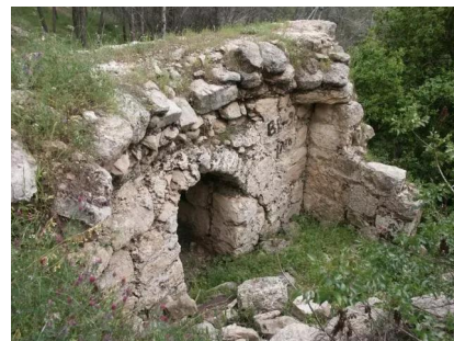
خربة اللوز المهجرة