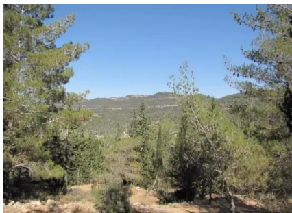
خربة اللوز: خربة اللوز