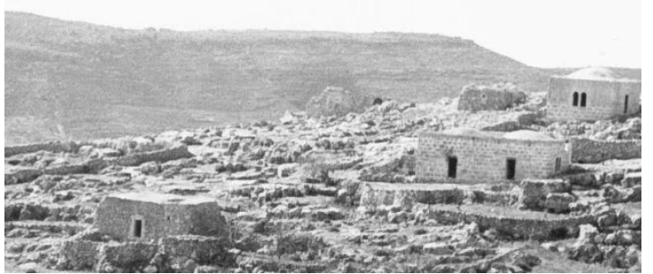
خربة اللوز: صورة نادرة للقرية في اوائل الخمسينات بعد التطير العرقي وقبل تدمير القرية