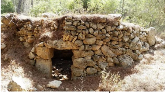
خرية اللوز: أطلال مقام الشيخ سلامه المدمر