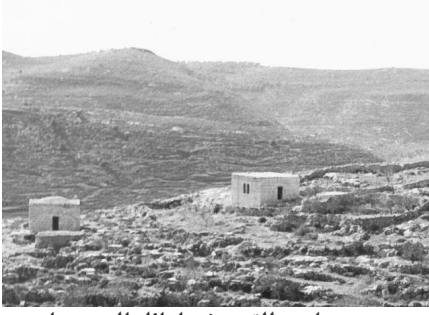
خربة اللوز: صورة نادرة للقرية في اوائل الخمسينات بعد التطير العرقي وقبل تدمير القرية