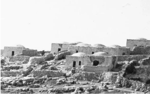
خربة اللوز: صورة نادرة للقرية في اوائل الخمسينات بعد التطير العرقي وقبل تدمير القرية