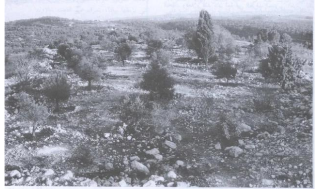
موقع القرية (سنة ١٩٨٦) [دير الهوا]

دير الهوا: الجنود الصهاينة في دير الهوى بعد إحتلالها.