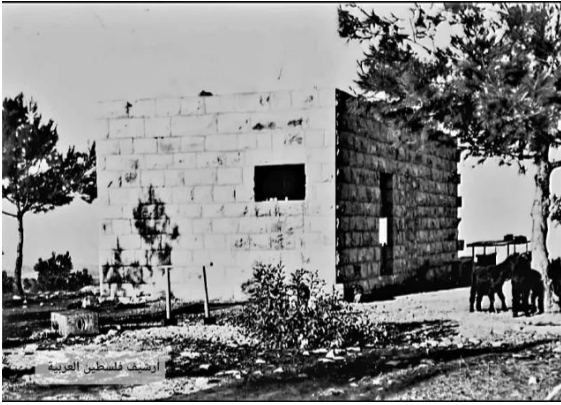
دير الهوا: صورة بيت من قرية دير الهوا قضاء القدس .. 1948