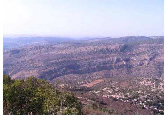
قرية دير الهوا