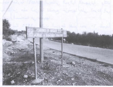
طريق هيبورت همفري يخترق ما كان يعدّ من أراضي القرية (سنة ١٩٨٦) [دير الهوا]

دير الهوا: منظر لموقع القرية التي دمرها الصهاينة وطهروا سكانها عرقياً. أطلال القرية المدمرة واضحة. 1986