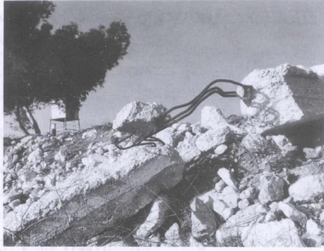
بقايا القرية وأبقاضها (سنة ١٩٨٦) [دير الهوا]

دير الهوا: منظر لموقع القرية التي دمرها الصهاينة وطهروا سكانها عرقياً. أطلال القرية المدمرة واضحة. 1986