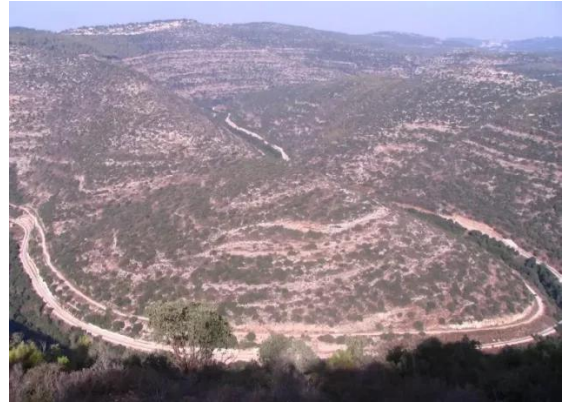
دير الهوا: دير الهوا