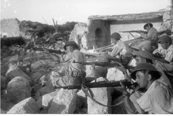
إحتلال عرتوف إبان النكبة