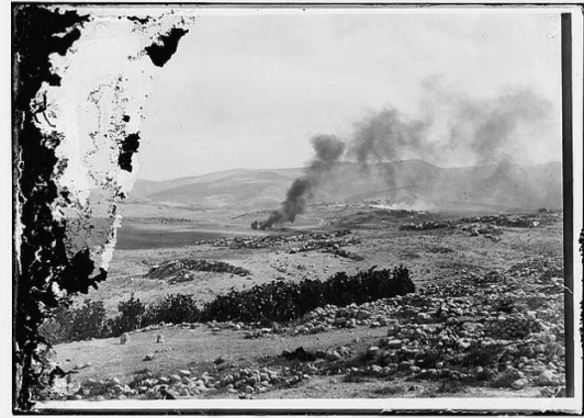
عرتوف: أحداث غضب في 1927