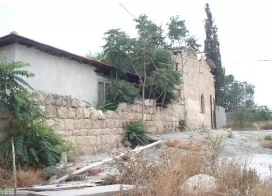
عرتوف: بيوت عرتوف