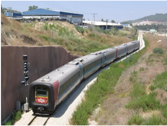
عرتوف: قطار عرتوف