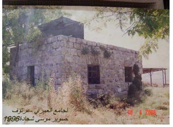
عرتوف: بيوت عرتوف