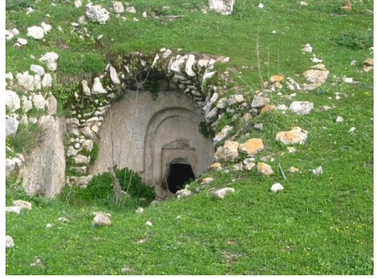
بيت عطاب: اثار من بعض البيوت التي بقيت بعد التطهير