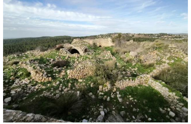
قرية بيت عطاب المهجرة

بيت عطاب: منظر لموقع القرية التي دمرها الصهاينة وطهروا سكانها عرقياً. أطلال القرية المدمرة واضحة. المبنى الموجود في اليسار الخلفي من الصورة هو آثار القلعة القديمة. 1986