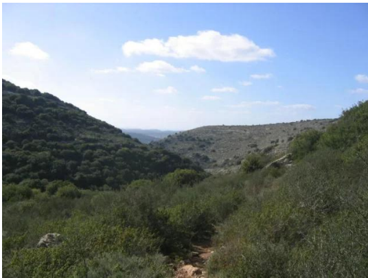
بيت عطاب: اراضي القرية

بيت عطاب: منظر عام لبيوت القرية والتي تم هدمها مباشرة بعد الاحتلال . ويمكن مشاهدة البيت الاخير قبل نسفه على يد بعض المفتصبين . حيث يمكن رؤيته على سطح المنزل . اخذت هذه الصورة بتاريخ 1948