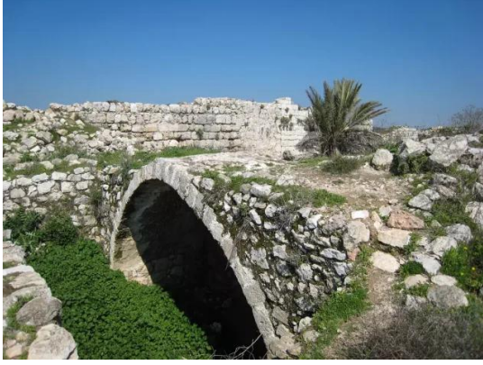
بيت عتاب: بيوت بيت عتاب حيث يقوم المغتصبون اليهود بزيارتها كمعالم جميلة في جبال القدس