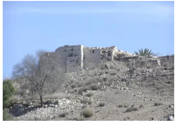
بيت عتاب: بقايا القلعة الموجه بالقرية