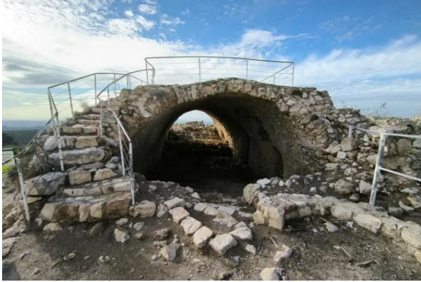
بيت عتاب: جولة حديثة بين انقاض واطلال بيوت بيت اعطاب المدمرة