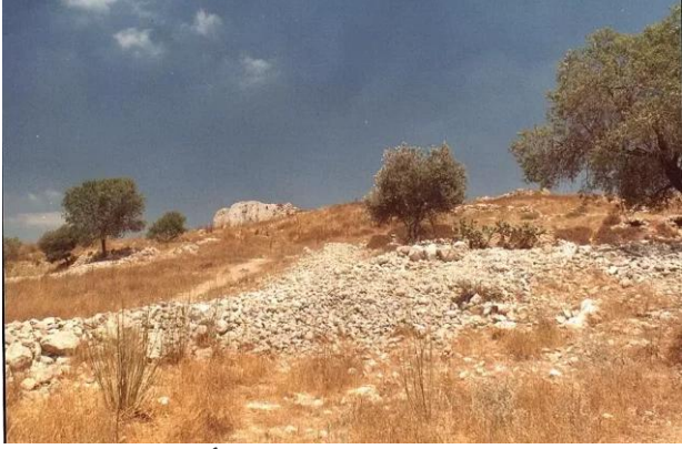
بيت عطاب: بقايا بيوت الأجداد