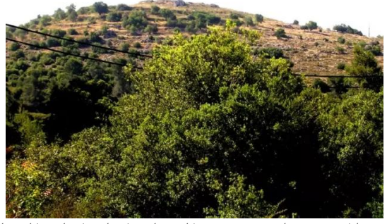
بيت عطاب: منطقة تعرف بالعلالي انظر اعلى الجبل - بيت عطاب