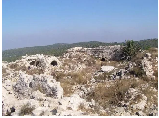
بيت عتاب: بقايا البيوت بعد تدميرها من قبل العصابات الصهيونية