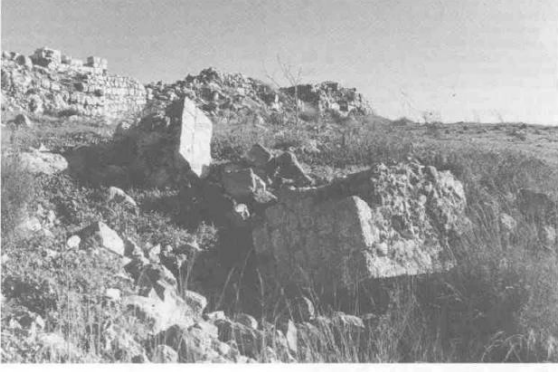
The remains of the fortress (left background) and rubble of village houses. (1986) SHAYY YEMAH

بيت عطاب: منظر لموقع القرية التي دمرها الصهاينة وطهروا سكانها عرقياً. أطلال القرية المدمرة واضحة. المبنى الموجود في اليسار الخلفي من الصورة هو آثار القلعة القديمة. 1986