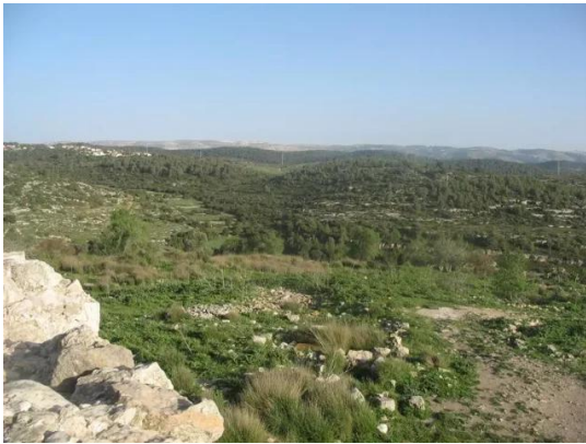
بيت عتاب: اراضي القرية - ربيع قرية بيت عتاب 3- 2008