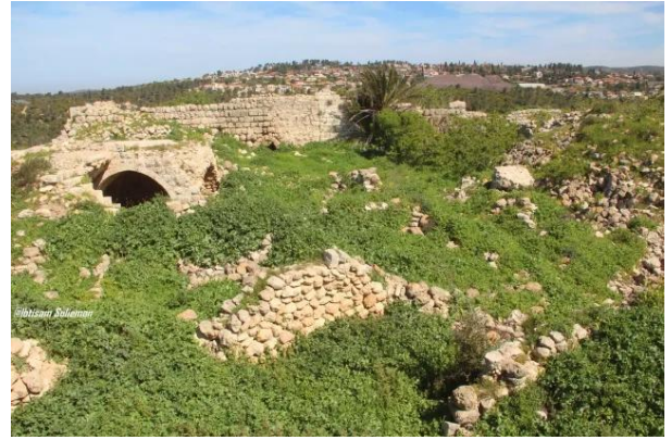
بيت عتاب: احد البيوت التي سلمت من التطهير - ربيع قرية بيت عتاب