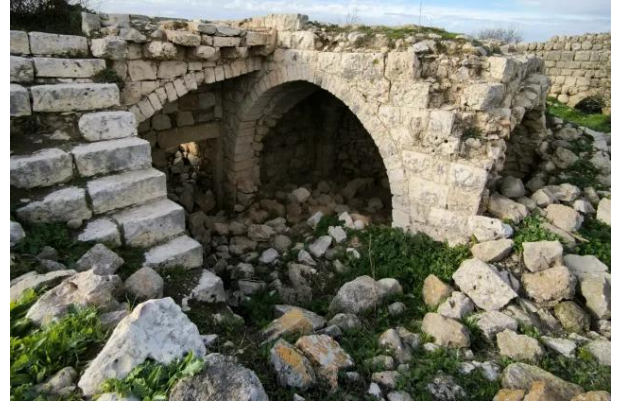
بيت عتاب: بيوت القرية بعد تطهيرها