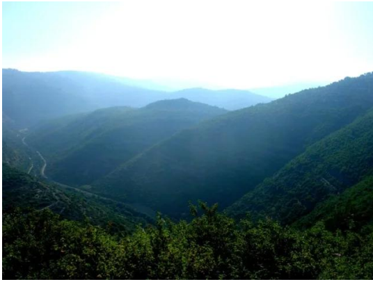
بيت عطاب: منظر لاراضي القرية من الناحية الغربية