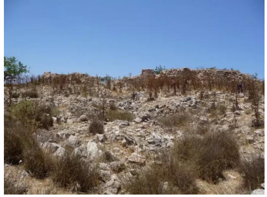
بيت عتاب: اراضي القرية