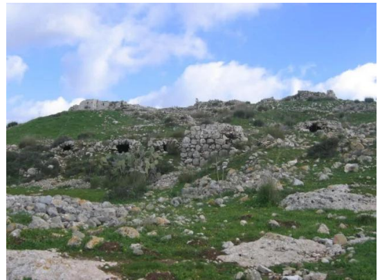
بيت عطاب: بقايا بعض الاحجار من بيوت هدمت