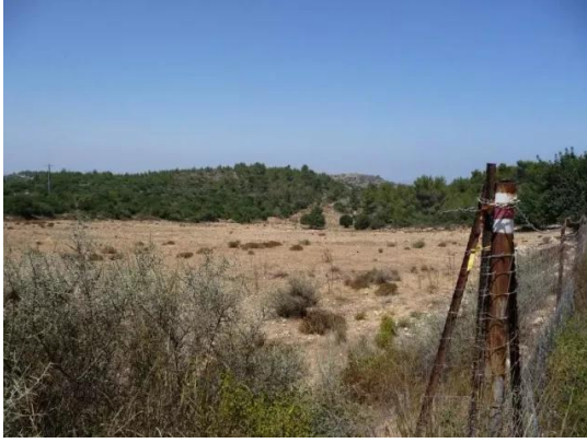
بيت عتاب: اراضي القرية