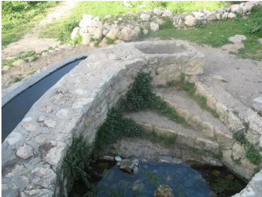
بيت عتاب: احد بنايب القرية - ربيع قرية بيت عتاب