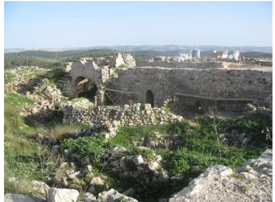
بيت عتاب: جولة حديثة بين انقاض واطلال بيوت بيت اعطاب المدمرة