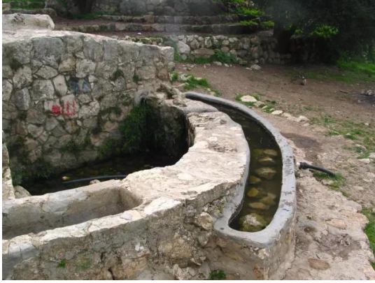
بيت عطاب: احدى ينابيع الماء في القرية