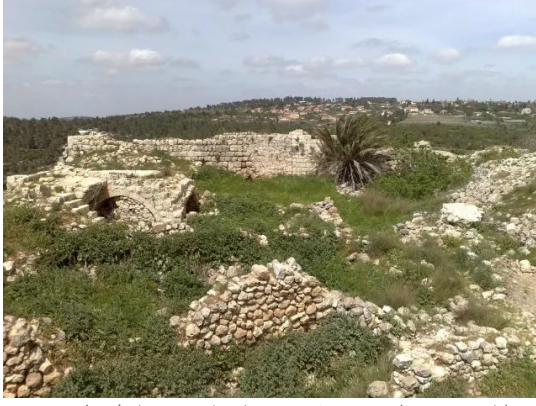
بيت عطاب: جولة حديثة بين انقاض واطلال بيوت بيت اعطاب المدمرة