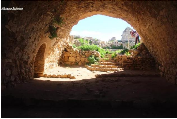
اثار بيوت قرية بيت عقاب المهجرة