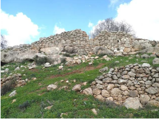
قرية دير بان المهجرة