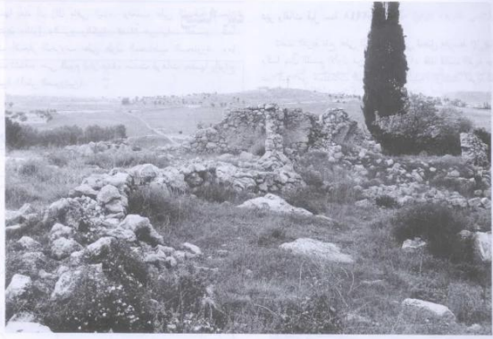
أنقاض وبقايا منازل في موقع القرية (سنة ١٩٨٦) [دير أبان]

دير أبان: أنقاض البيوت المدمرة واضحة. 1986