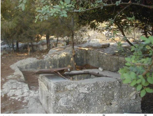
دير آبان: إحدى آبار القرية المدمرة.