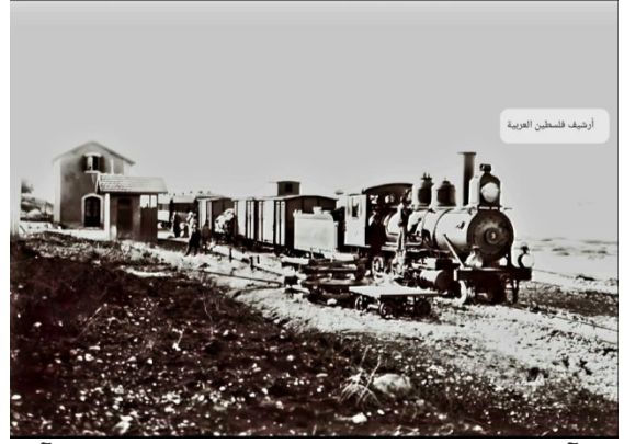
دير آبان: قطار الحجاز يتحرك من محطة دير آبان قضاء القدس نحو الرملة عشرينيات القرن العشرين..