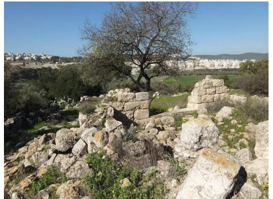
دير آبان: جولة بين انقاض قرية دير آبان المهجرة والمدمرة #10