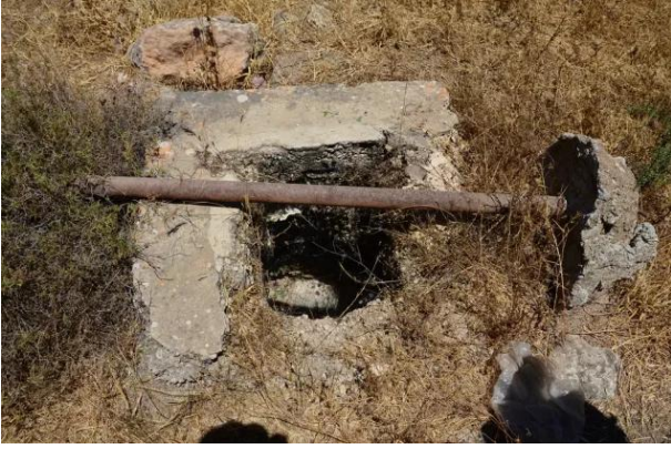
قرية دير بان المهجرة