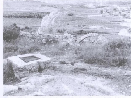
بقايا موقع القرية، وتظهر مستعمرة محسبا في أقصى الصورة (سنة ١٩٨٦) [دير أبان]

دير أبان: أنقاض البيوت المدمرة واضحة. 1986