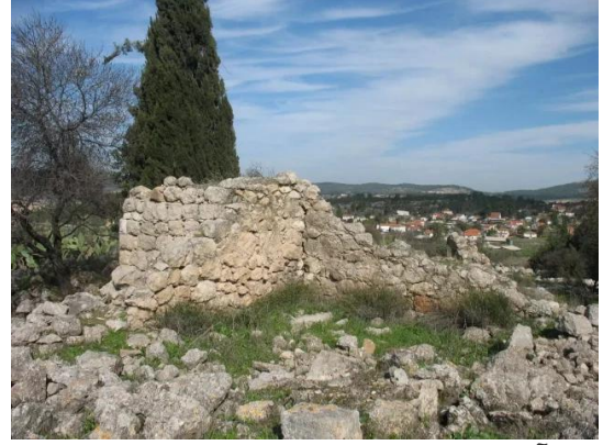
دير آبان: انقاض القرية المدمرة وتظهر إحدى المقتصبات الصهيونية في الخلف، أنقر الصورة لتكبيرها.