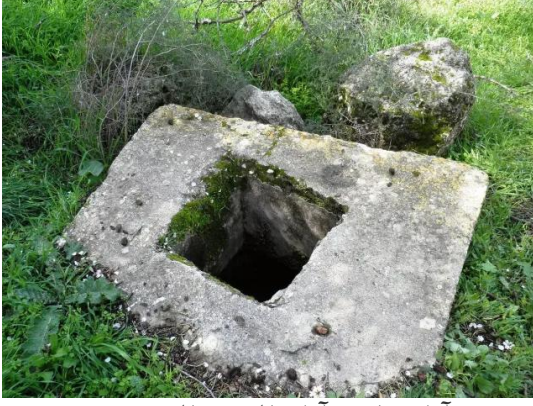
دير آبان: احد آبار القرية المغتصبة #2