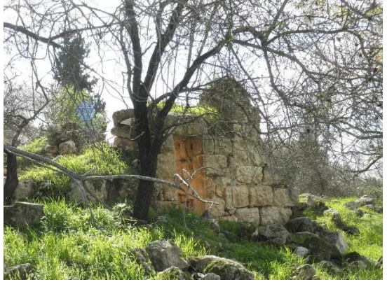
دير آبان: جولة بين انقاض قرية دير آبان المهجرة والمدمرة #6