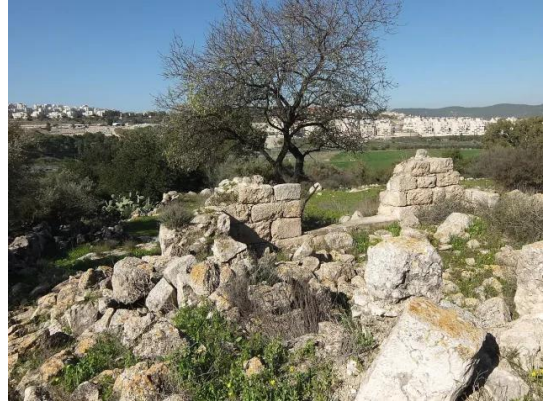
دير آبان: جولة بين انقاض قرية دير آبان المهجرة والمدمرة #10