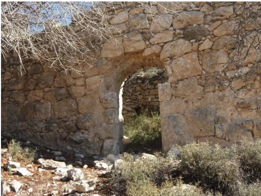
دير آبان: جولة بين انقاض قرية دير آبان المهجرة والمدمرة #13