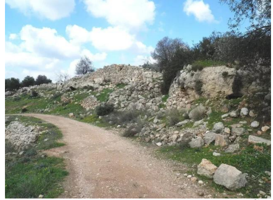
دير آبان: جولة بين انقاض قرية دير آبان المهجرة والمدمرة