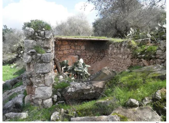
دير آبان: جولة بين انقاض قرية دير آبان المهجرة والمدمرة #4