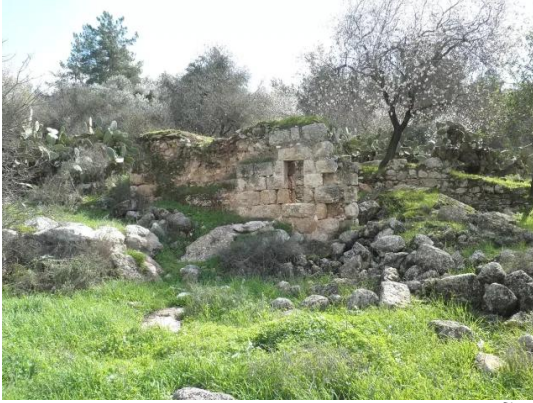
دير آبان: جولة بين انقاض قرية دير آبان المهجرة والمدمرة #5