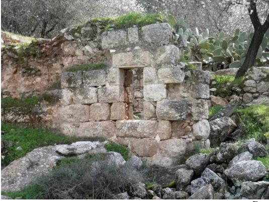
دير آبان: جولة بين انقاض قرية دير آبان المهجرة والمدمرة #3