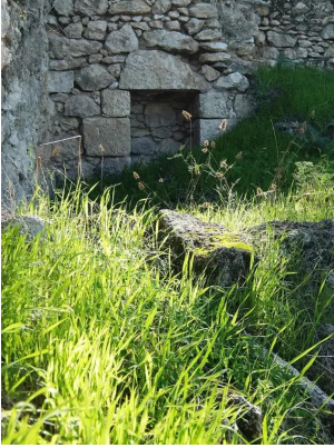
دير آبان: جولة بين انقاض قرية دير آبان المهجرة والمدمرة #9