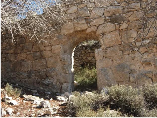
دير آبان: جولة بين انقاض قرية دير آبان المهجرة والمدمرة #13