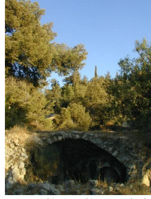
دير آبان: اطلال لبيوت القرية المدمرة. #3