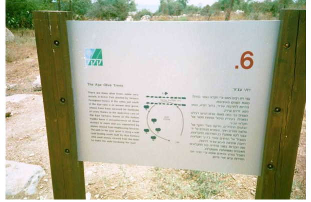
عجور: تم تحويل اراضي القرية لمحمية طبيعية للإسرائيليين