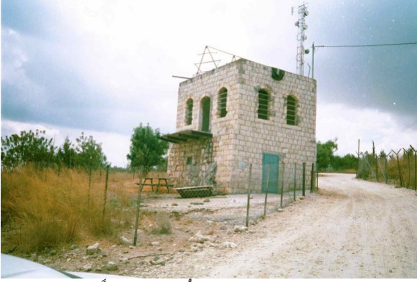
عجور: بيت لفلسطيني مُطهر عرقياً، 2002