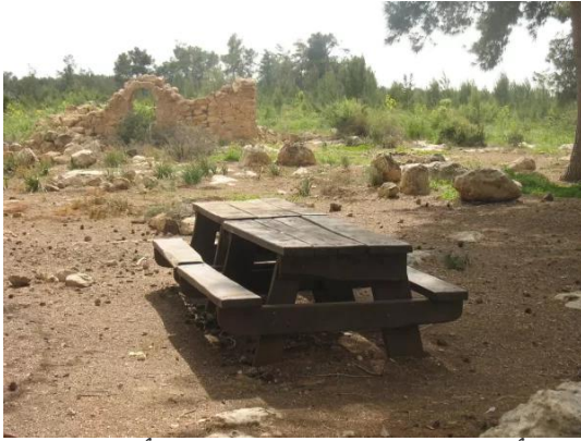
عجور: أطلال البيوت المدمرة والآن أصبحت متنزه مدعوم من الصندوق القومي اليهودي