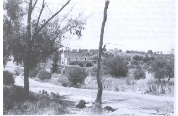
موقع القرية، وبعض المنازل الباقية (حزيران/يونيو ١٩٨٧) [عجور]

عجور: منظر لموقع القرية التي دمرها الصهاينة وطهرها سكانها عرقياً ويظهر بيت لم يدم