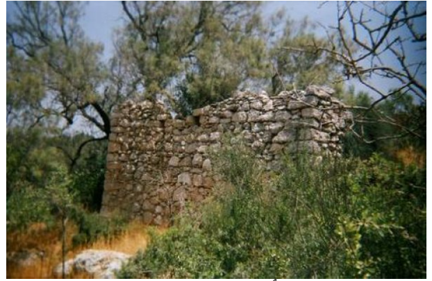
عجور: أطلال البيوت المدمرة