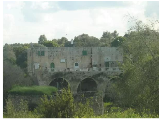
عجور: إحدى البيوت المفتصة التي تم ترميمها من قبل إسرائيليين بعد النكبة