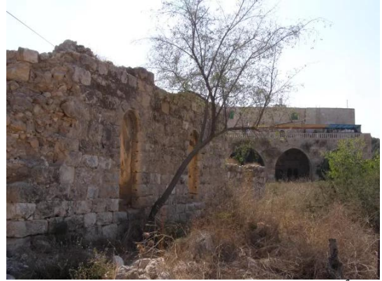
عجور: أطلال مبنى معصرة الزيتون والمطحنة التابعة لعائلة العزة، وخلفها منزل العائلة، أكتوبر 2008