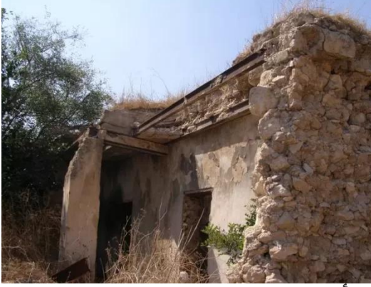
عجور: أطلال مبنى معصرة الزيتون والمطحنة التابعة لعائلة العزة، أكتوبر 2008