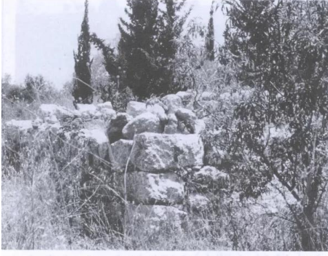
بقايا أحد منازل القرية (حزيران/يونيو ١٩٨٧) [عجور]