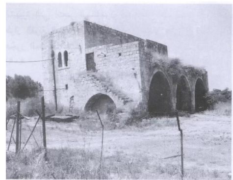
أحد منازل القرية (حزيران/يونيو ١٩٨٧) [عجور]

عجور: صورة نادرة للقرية والصهاينة يحتلونها، تموز 1948