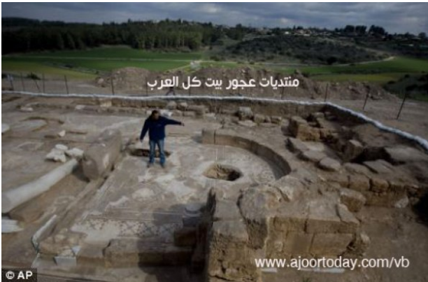
عجور: عجور- خربة أدروسية (مدراس كما يسميها اليهود)