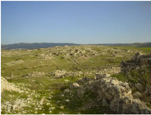
عجور: منظر عام - 2008