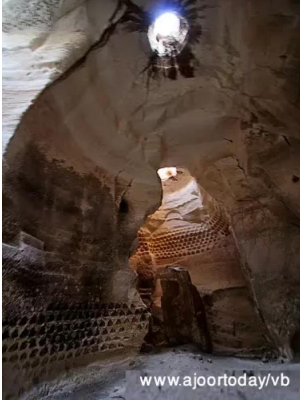
عجور: عجور- كهف الجرس- Bell Cave