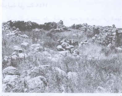
أبقاض المنازل وما بقى منها فى مركز موقع القرية. المشهد كما يبدو للناظر من الشمال إلى الجنوب (حزيران/يونيو ١٩٩٠) [خربة أم برج]

خربة أم برج: منظر فى الاتجاه الجنوبى من مركز القرية التى دمرها الصهاينة وطهروا سكانها عرقياً