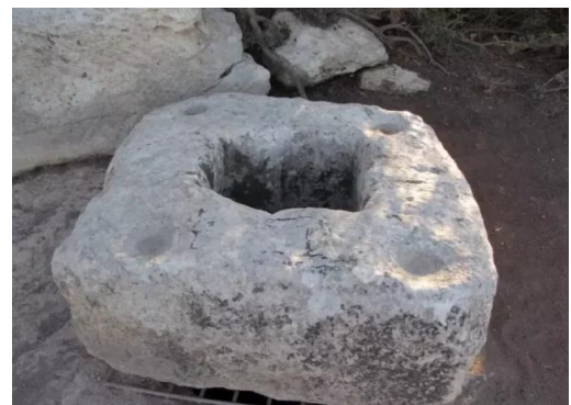
خربة أم برج: اثار خربة أم برج