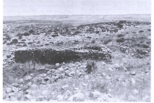
مشهد إلى الشرق كما يبدو للناظر إليه من مركز موقع القرية (حزيران/يونيو ١٩٩٠) [خربة أم برج]

خربة أم برج: منظر فى الاتجاه الجنوبى من مركز القرية التى دمرها الصهاينة وطهروا سكانها عرقياً