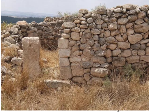
خربة أم برج: منظر عام لانقاض القرية