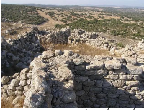
خربة أم برج: أطلال، آب 2008