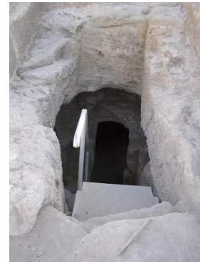
خربة أم برج: كهوف في قرية أم برج المهجرة