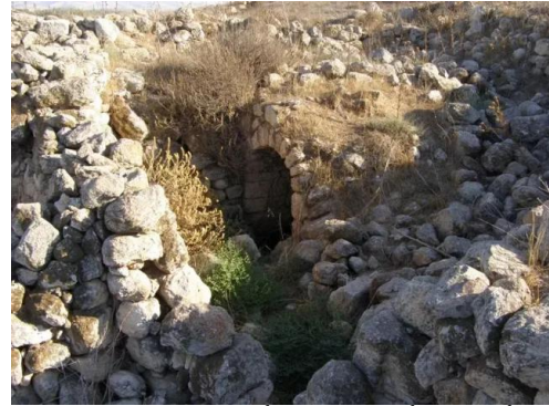
خربة أم برج: أطلال مبنى أثري، آب 2008