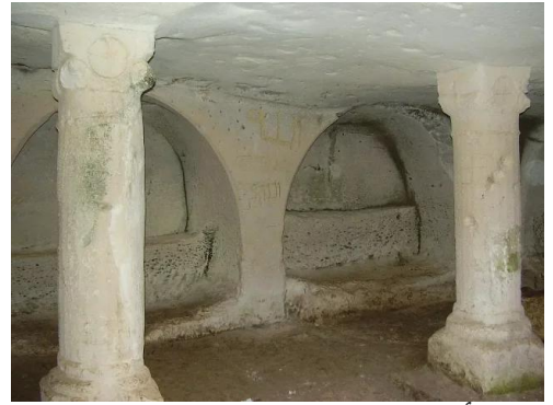
خربة أم برج: كهوف في قرية ام برج المهجرة