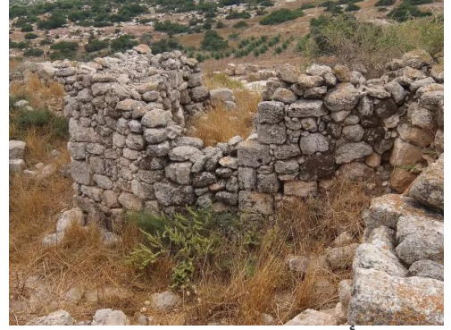
خربة أم برج: منظر عام لانقاض القرية