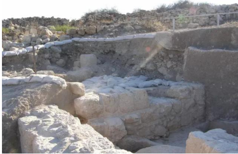
خربة أم برج: يبحثون عن تاريخ الزمن الغابر ويدفنون آثار العرب، آب 2008