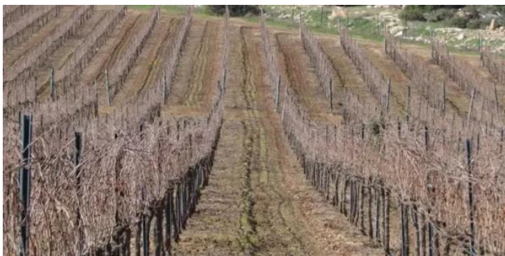
خربة أم برج: خربة أم برج