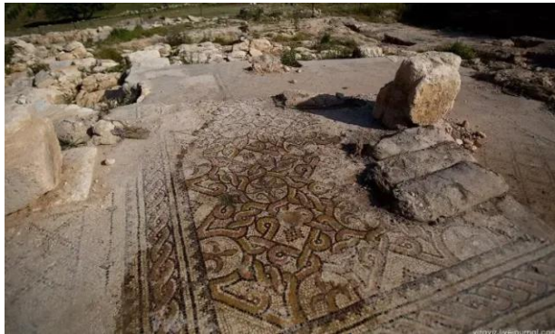
خربة أم برج: خربة أم برج