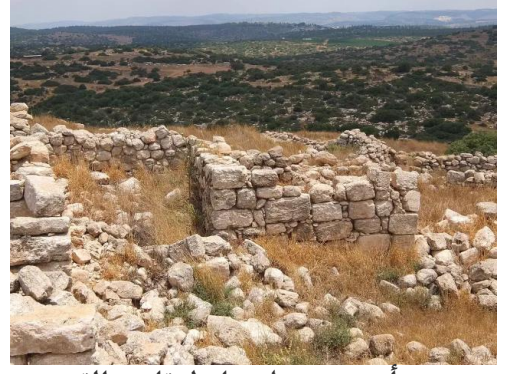
خربة أم برج: منظر عام لانقاض القرية