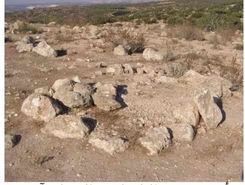
خربة أم برج: قبور الفلسطينيين المهملة، آب 2008