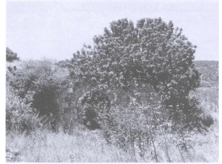
حائط فى مدخل مقوَس (حزيران/يونيو ١٩٩٠) [خربة أم برج]

خربة أم برج: أطلال بيت فى القرية المدمرة. 1990