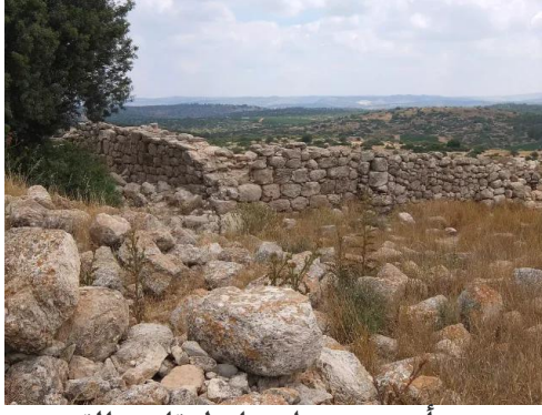
خربة أم برج: منظر عام لانقاض القرية