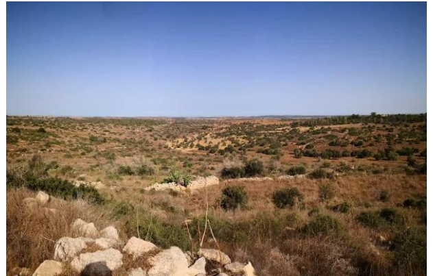
كدنة: جولة بين انقاض قرية كدنا المدمر