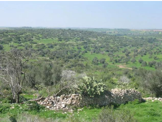
كدنة: جولة بين انقاض قرية كدنا المدمر