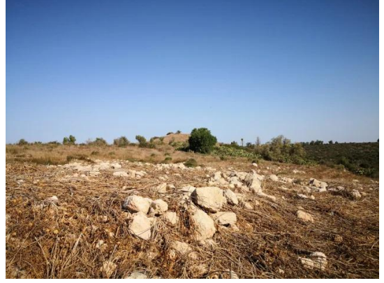
كدنة: جولة بين انقاض قرية كدنا المدمر