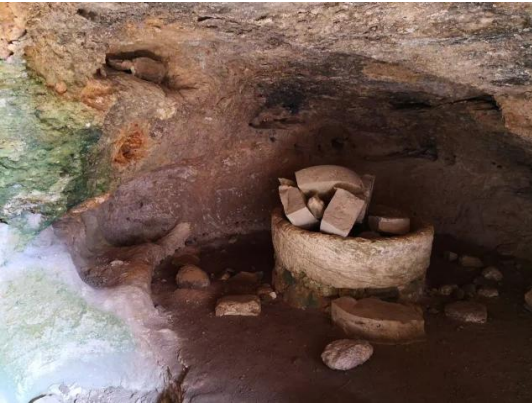
كدنة: جولة بين انقاض قرية كدنا المدمر