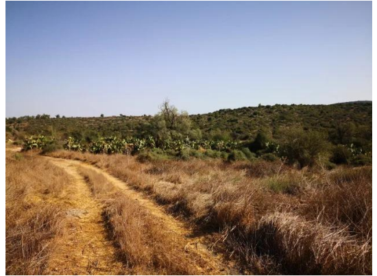
كدنة: جولة بين انقاض قرية كدنا المدمر