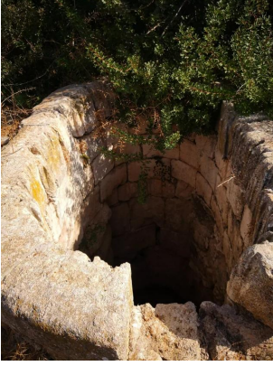
كدنة: جولة بين انقاض قرية كدنا المدمر