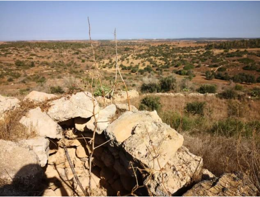
كدنة: جولة بين انقاض قرية كدنا المدمر