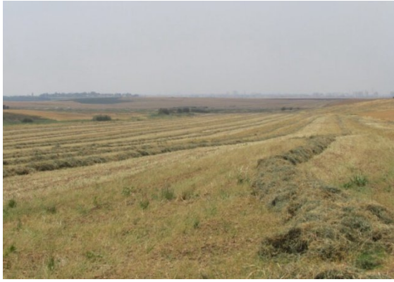
زيتا: اراضي زيتا