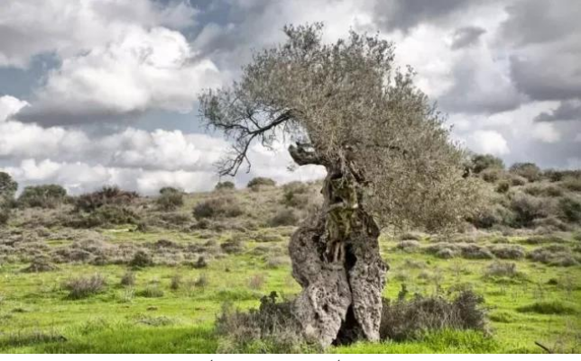
زيتا: زيتون زيتا