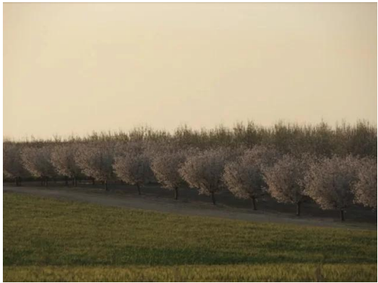
ياصور: أراضي ياصور