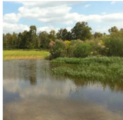
ياصور: من شمال ياصور