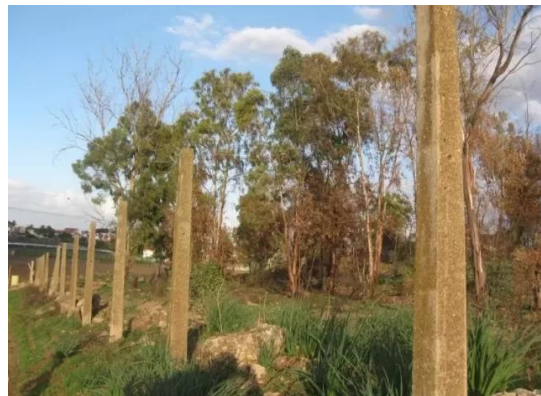
ياصور: موقع القرية محاط بالسياج