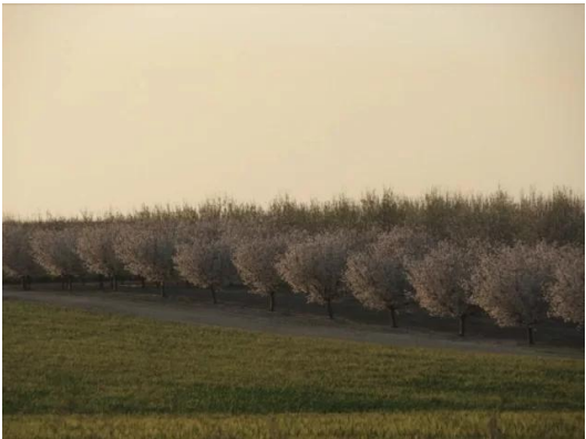
ياصور: أراضي ياصور