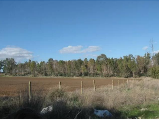
ياصور: أراضي ياصور