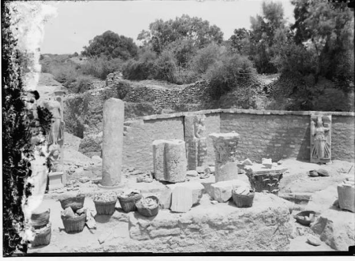
ياصور: آثار قديمة بالقرب من القرية