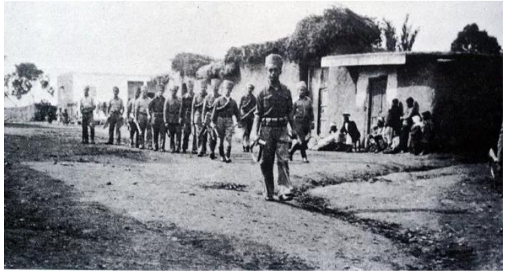
ياصور: فرقة من الشرطة المحلية في قرية ياصور قضاء غزة قبل النكبة 1948 م