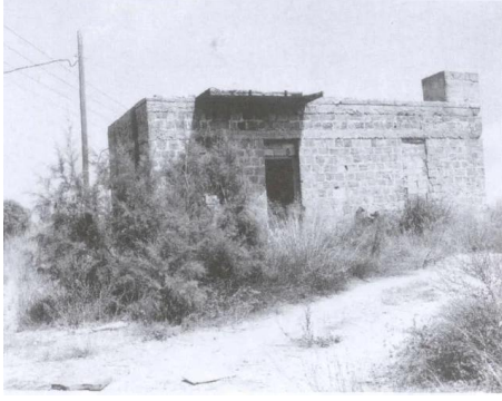
برقة: إحدى بيوت القرية التي سلمت من التدمير