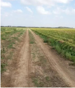
برقة: اراضي القرية