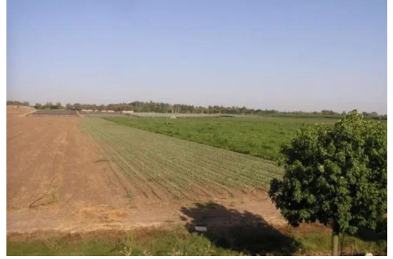
برقة: اراضي القرية