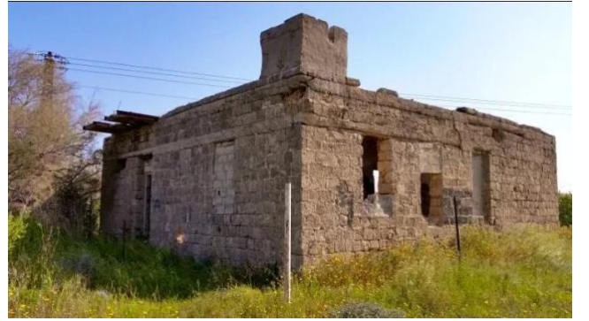
برقة: إحدى بيوت القرية التي سلمت من التدمير