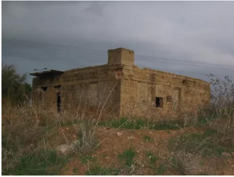
برقة: إحدى بيوت القرية التي سلمت من التدمير