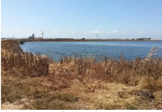
برقة: من شرق القرية