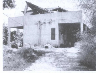
أحد المنازل الباقين من منازل القرية، ويستعمله الإسرائيليون اليوم مستودعاً (حزيران/ يونيو ١٩٨٧) [برقة]