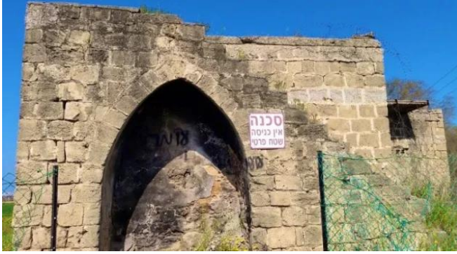
برقة: إحدى بيوت القرية التي سلمت من التدمير