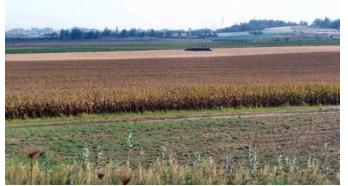
برقة: اراضي القرية