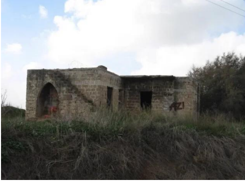
برقة: بيت باقي في القرية