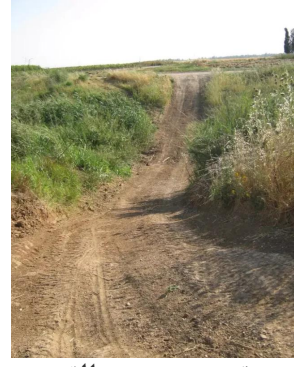
برقة: من جنوب القرية