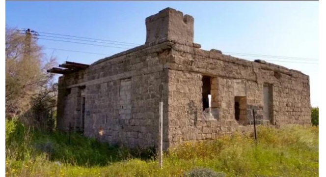
برقة: إحدى بيوت القرية التي سلمت من التدمير