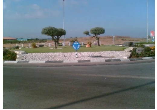
برقة: من موقع القرية