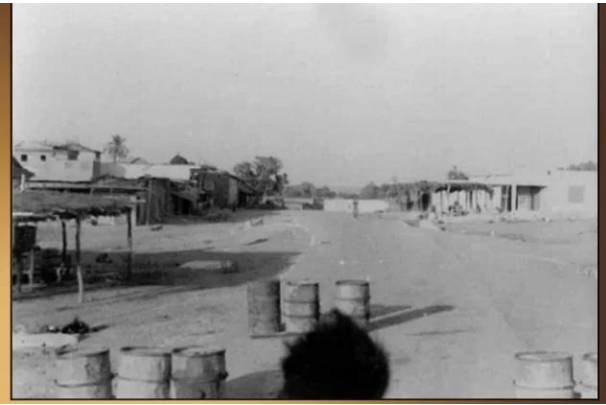
Isdud - Gaza