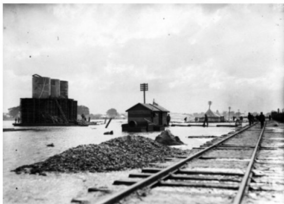
Isdud - Gaza