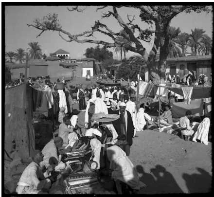
Isdud - Gaza