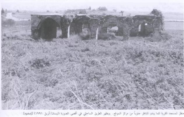
منظر للمسجد القرية كما يبدو للناظر جنوباً من مركز الموقع . ويظهر الطريق الساحلي في أقصى الصورة (تيسا/أبريل 1944) (إسكودا)