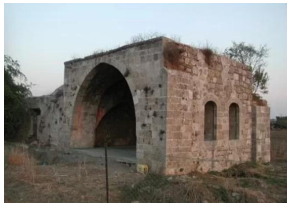
Isdud - Gaza