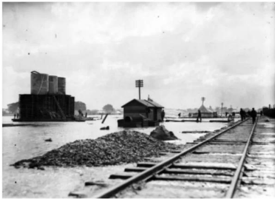
Isdud - Gaza