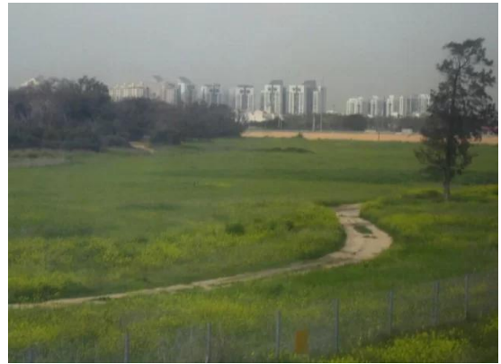
Isdud - Gaza