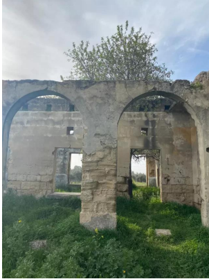
Isdud - Gaza