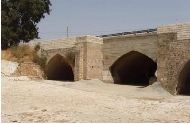
Isdud - Gaza