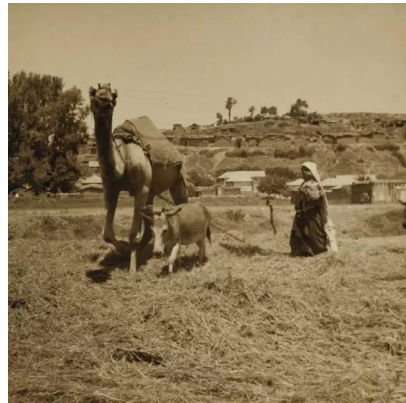
Isdud - Gaza