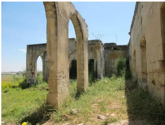
Isdud - Gaza