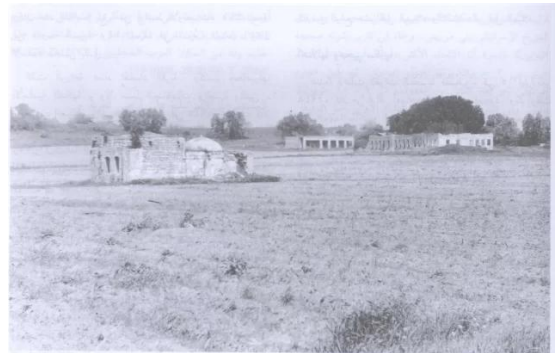
أي ما يقابل من إسدود: هربح أحد الأبنية (إلى اليسار) بناها المدركيين (إلى اليمين) مسجد عرب (هو مربي، إلى أقصى اليمين). المشهد كما يبدو للناظر في اتجاه الشمال الشرقي من نقطة تقع جنوبي غربي القريح. وتقع هذه الجدران إلى الغرب من وسط الموقع حيث كان معظم منازل القرية فيما مضى (إسدود) أبريل ١٩٨١