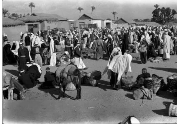
Isdud - Gaza