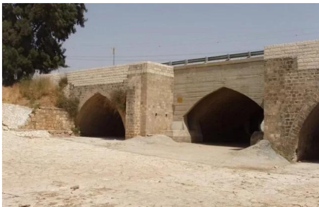
Isdud - Gaza