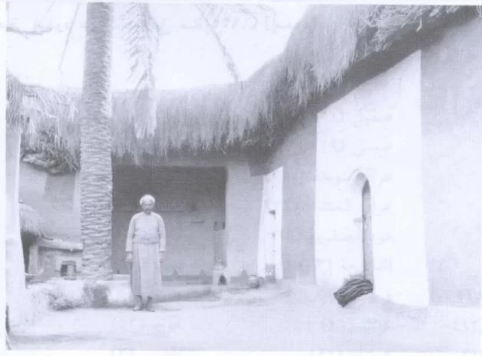
الحوش نفسه من زاوية أخرى (نحو سنة ١٩٤٥) [إسدود]