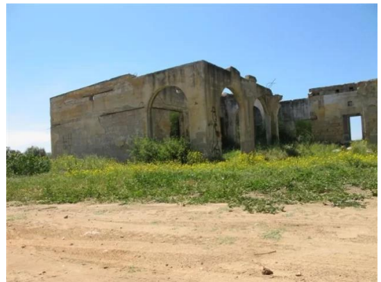
Isdud - Gaza