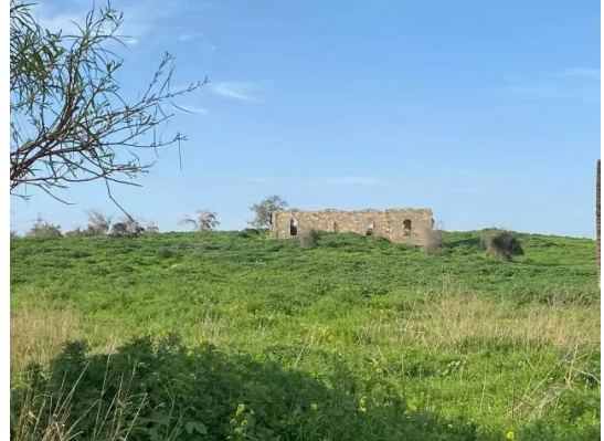
Isdud - Gaza