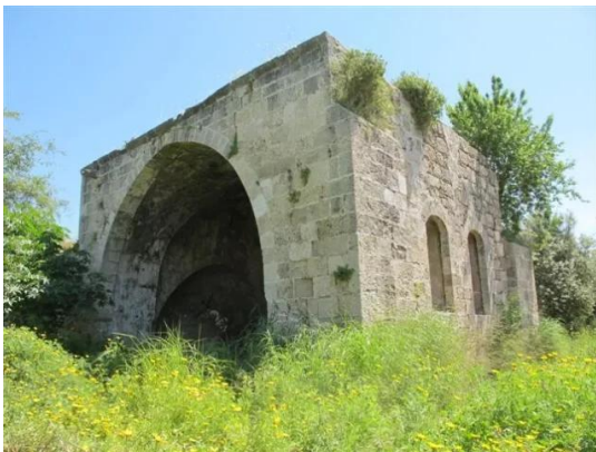
Isdud - Gaza