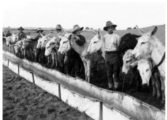
Isdud - Gaza