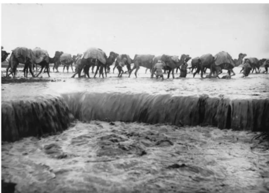
Isdud - Gaza