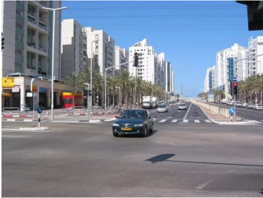
Isdud - Gaza