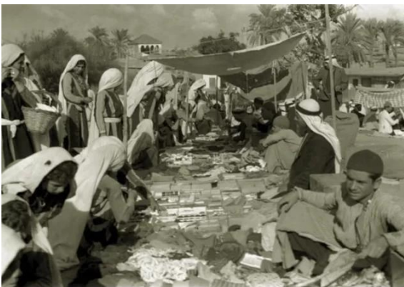
Isdud - Gaza