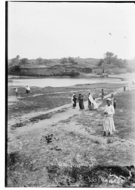
Isdud - Gaza