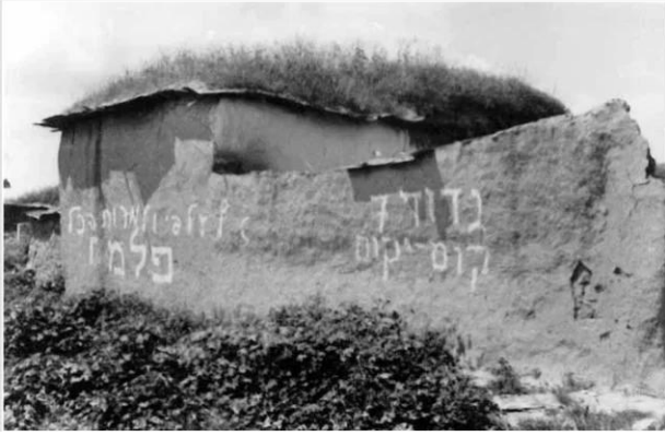
قسطينة: بيوت القرية بعد احتلالها