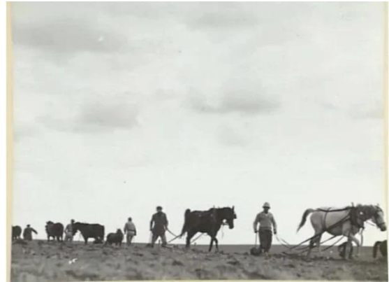
حراثته اراضي القسطينة سنة 1940