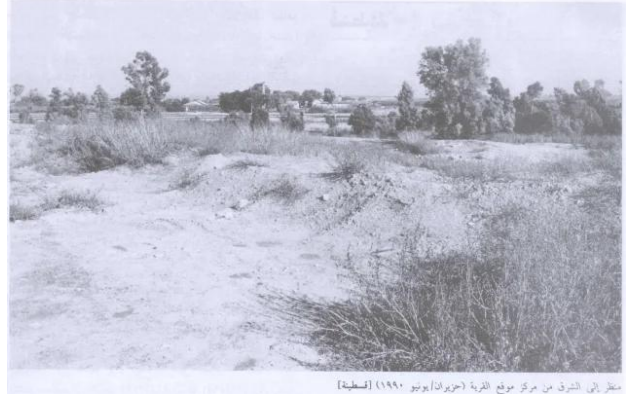
قسطينة: منظر لاراضي موجودة للشرق من مركز القرية