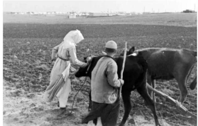
قسطينة: صوره لطفل ووالدته يفلحون اراضيهم في القسطينة سنة 1940