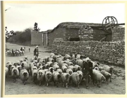
قسطينة: راعي اغنام في القسطينة