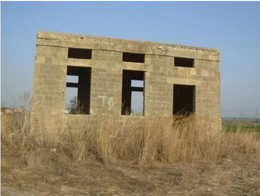
جسير: مدرسة الجسير