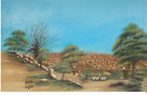
جسير: صورة لقرية جسير من الناحية الغربية - من ناحية طريق كرتيا السوافير - تصوير تشكيلي بريشة الفنان التشكيلي خالد يوسف بناءً على البحث العلمي وشهادات أهل القرية واستناداً إلى خرائط الأقمار الصناعية -