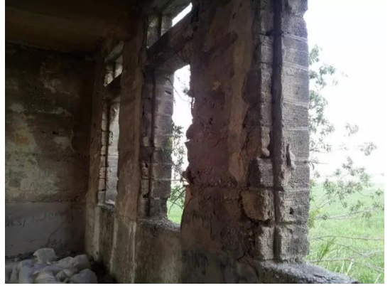
جسير: جدران المدرسه