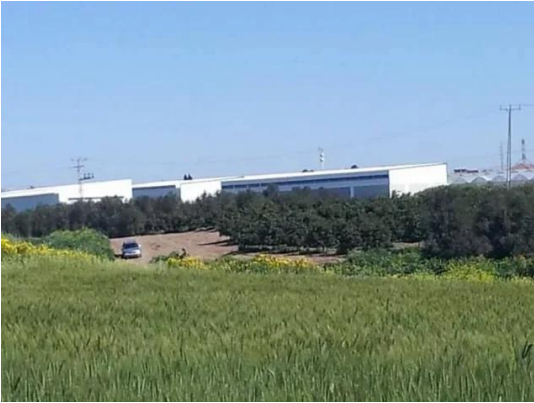
جسير: اطراف احدى المستوطنات فوق اراضي البلدة