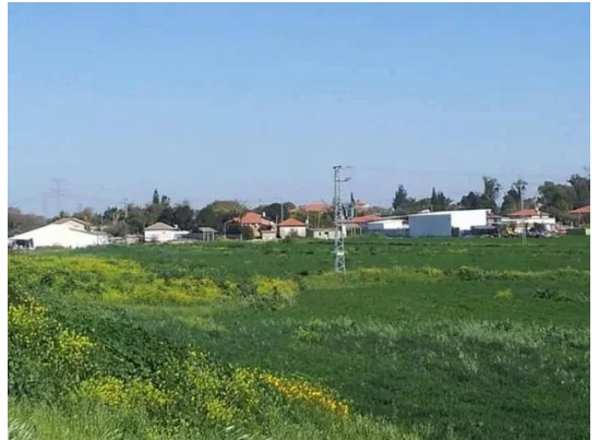
جسير: مستوطنة أخرى على أراضي البلدة بتاريخ