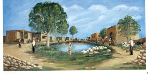
جسير: صورة لقرية جسير من الناحية الجنوبية الغربية - من ناحية البركة - تصوير تشكيلي بريشة الفنان التشكيلي خالد يوسف بناءً على البحث العلمي وشهادات أهل القرية المهجرين منها واستناداً إلى خرائط الأقمار الصناعية -