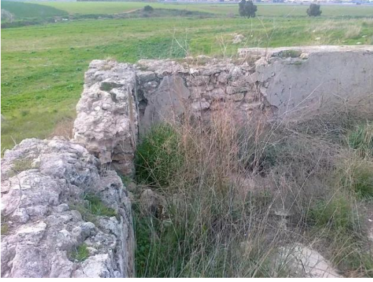
جسير: مدينة الجسير