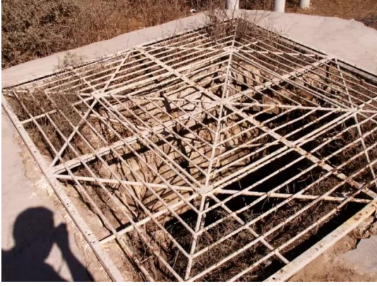
الجورة: بئر للماء بالقرب من الشاطئ