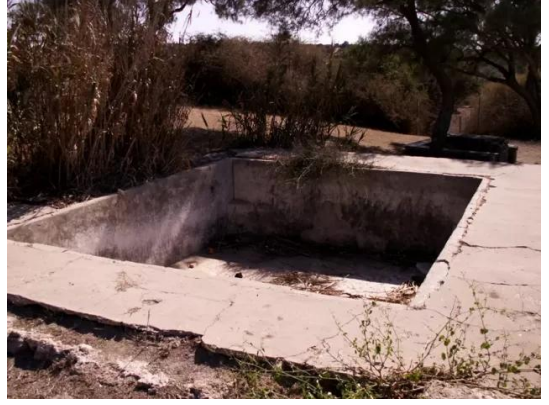
الجورة: بركة كانت تستخدم للري