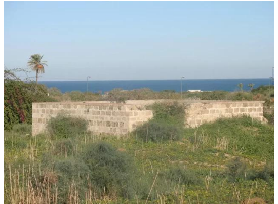
الجورة: احدى برك الري في القرية المغتصبة