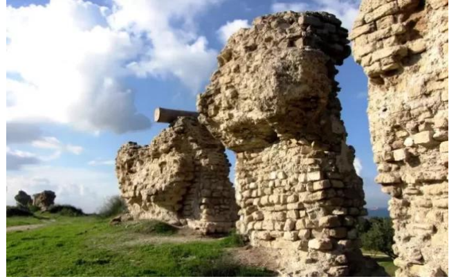
الجورة: الآثار القديمه غرب القرية