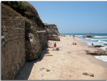
الجورة: شاطئ قرية الجورة