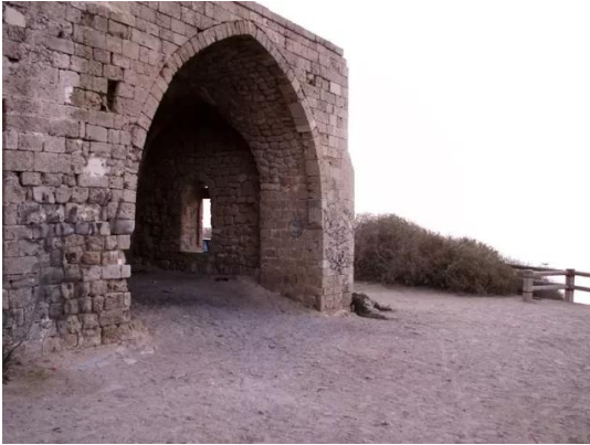
الجورة: مقام الشيخ عوض الموجود بالقرب من البحر