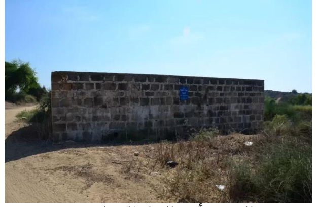
الجورة: أحد البرك التي لم تدمر