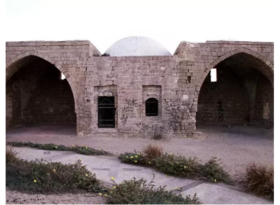
الجورة: مقام الشيخ عوض في قرية الجورة المهجرة (قضاء غزة)