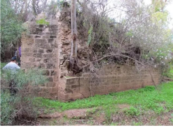
دير سنيد: بيت مهديم في القرية