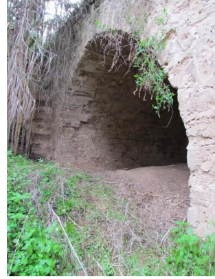
دير سنيد: جسر قديم في القرية