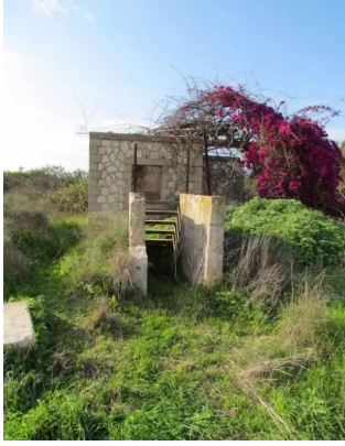
دير سنيد: محطه القطار القديمه في القرية