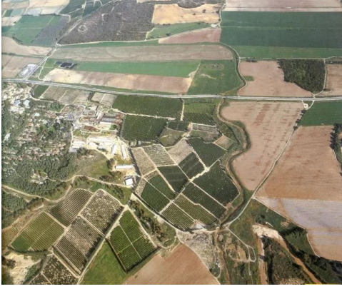
دير سنيد: صورة نادة من الجو للقرية في سنة 1994 . الجهة اليسرى من الصورة تؤشر نحو الجهة الشمالية.