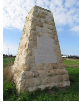
دير سنيد: النصب التذكارى في القرية