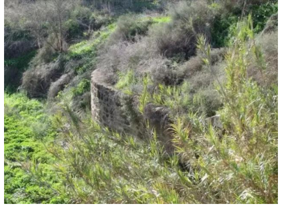
دير سنيد: اثار القرية