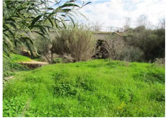
دير سنيد: من القرية