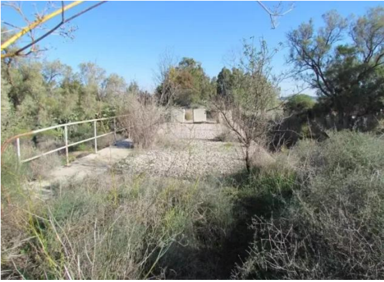
دير سنيد: منظر من القرية