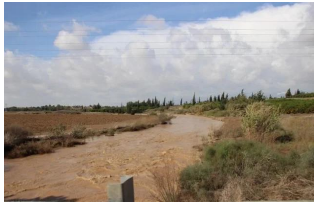
دير سنيد: وديان القرية