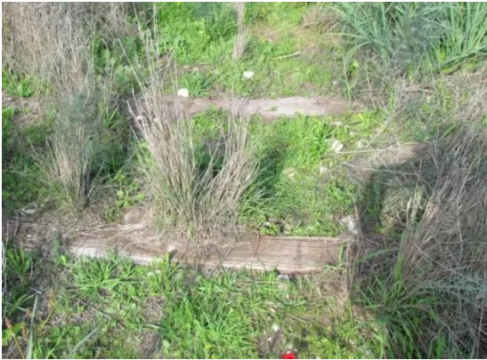
دير سنيد المهجرة قضاء غزة