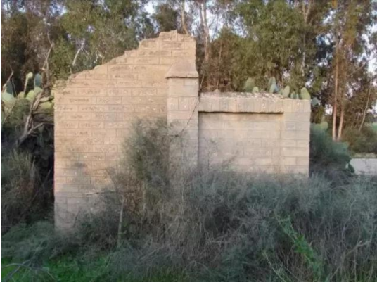
دير سنيد: اثار بيوت القرية