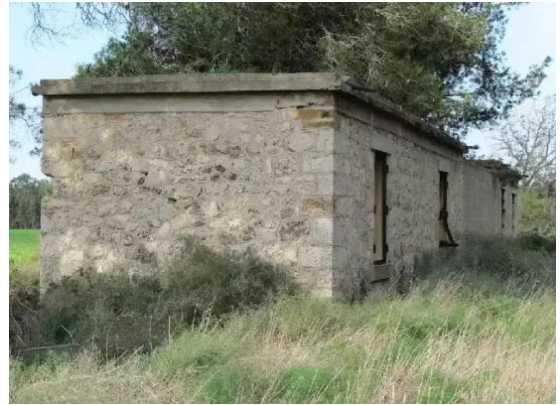
دير سنيد: احدى بيوت القرية