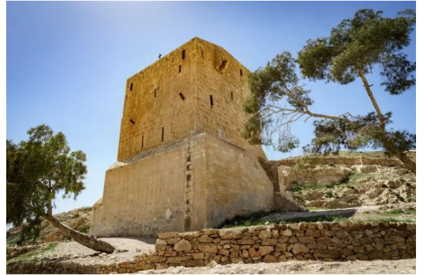
دير مار سابا - برج النساء