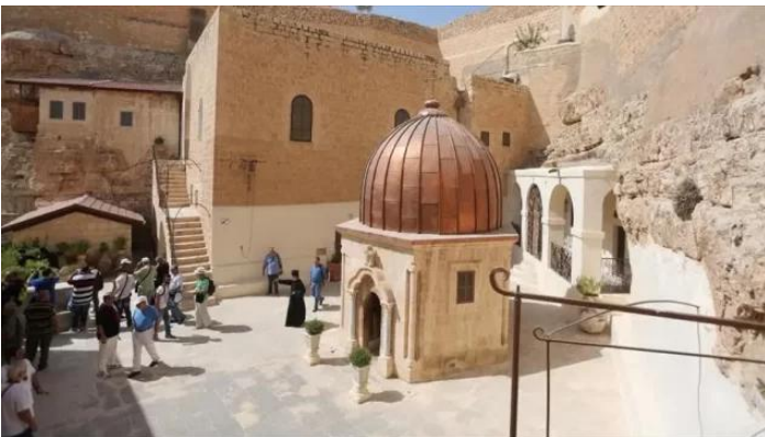
دير مار سابا