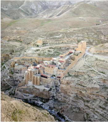
دير مار سابا، يطل على وادي قدرون بالضفة الغربية.