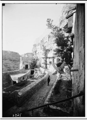
دير مار سابا