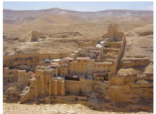
دير مار سابا