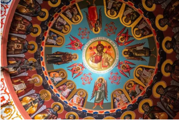
دير مار سابا - بيت لحم