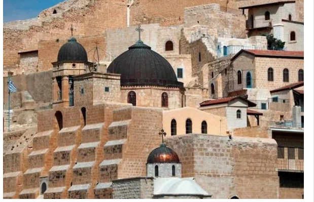
دير مار سابا