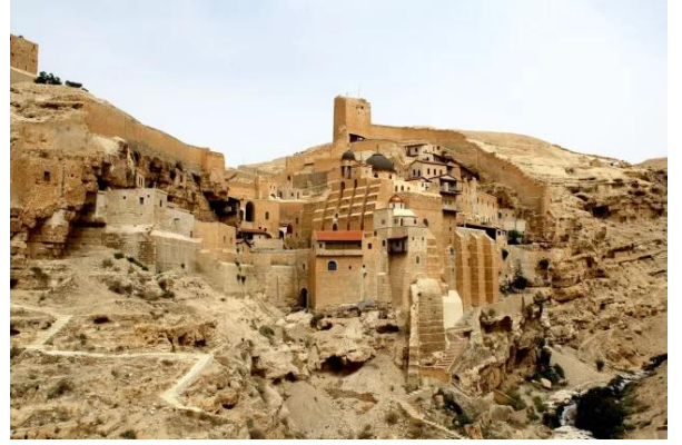
دير مار سابا - بيت لحم