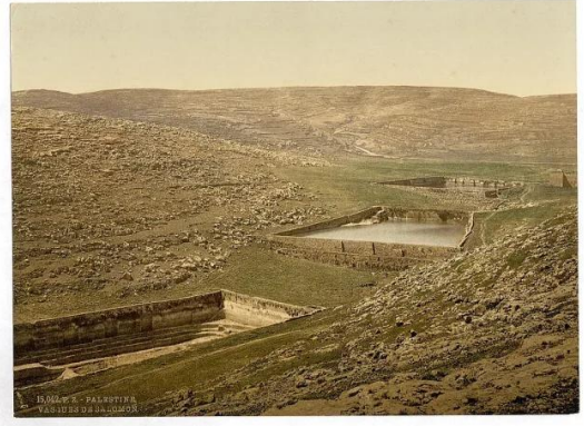
برك سليمان - بيت لحم