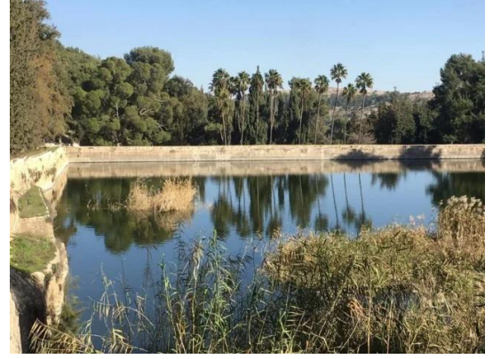
برك سليمان - بيت لحم