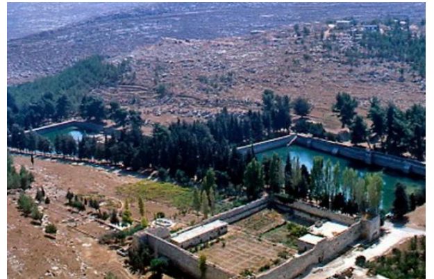
برك سليمان - بيت لحم