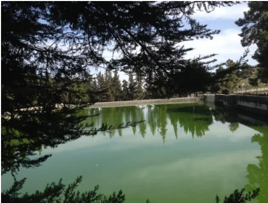
برك سليمان - بيت لحم