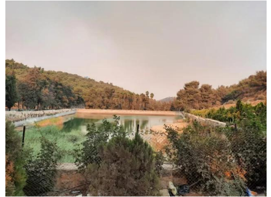
برك سليمان - بيت لحم