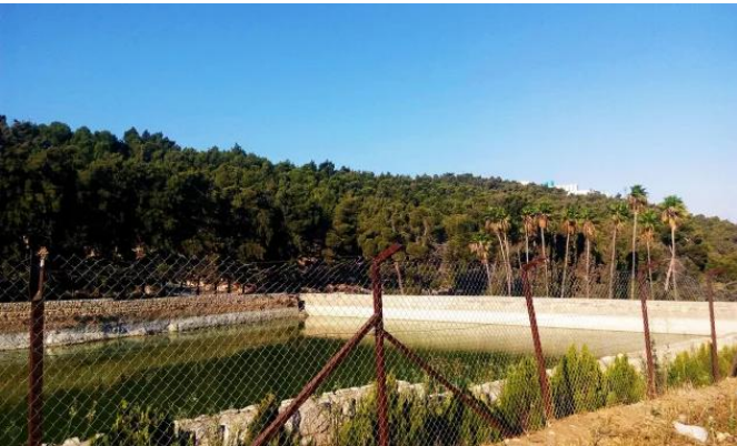
برك سليمان - بيت لحم