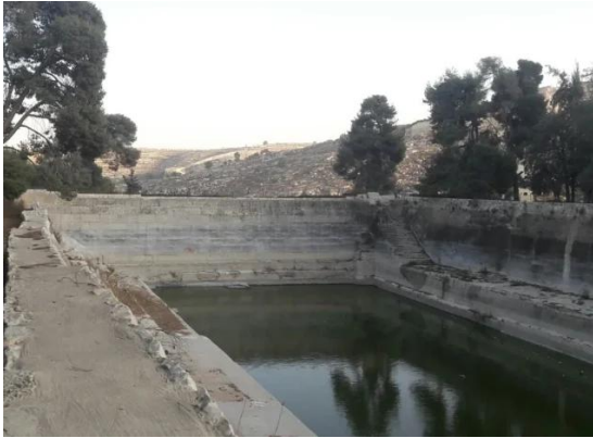
برك سليمان - بيت لحم