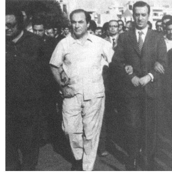
الشهيد كمال ناصر في جنازة الشهيد غسان كنفاني ، و الذي تمنى وهو يسير فيها أن يكون له يوم شبيهه عندما يزفه شعبه شهيد لفلسطين فكان له ما أراد ، ويستند بالصورة على الصحفي اللبناني الراحل رياض طه ، والدبلوماسي والمفكر العربي اللبناني الراحل كلوفيس مقصود .