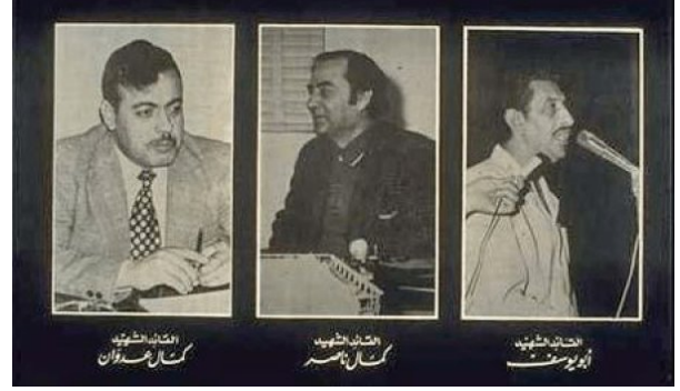
شهداء عملية فردان

إننا نلتزم بالثورة حتى النصر أو الموت ا فيديو نادر للشهيد كمال ناصر، القيادي في منظمة التحرير ورئيس تحرير مجلة فلسطين الثورة، خلال تحيته للجماهير - يقدر عددهم بـ ٥٠ ألفا- التي احتشدت في عمان، يوليو ١٩٧٠، رفضا لمبادرة روجرز الأمريكية للسلام - المناهزة لـ"إسرائيل"