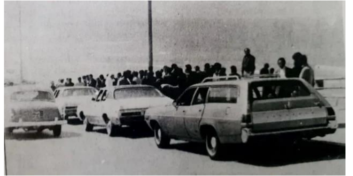
السيارات التي استخدمتها القوات الإسرائيلية بعدما تركتها على شاطئ بيروت بعد الغارة