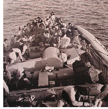
القوات الخاصة الإسرائيلية مع زوارق مطاطية على متن زورق صواريخ أثناء العملية