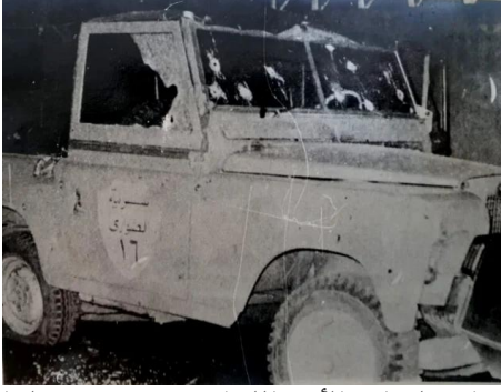
سيارة تابعة لقوات الأمن اللبنانية تضررت خلال الغارة