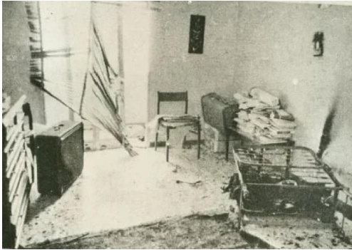
شقة كمال عدوان عقب الغارة

ملحمة بطولة.. في زمن الهزائم الرسمية | اللبنانيين موسى ويوسف ناصر، من شهداء عملية فردان ١٠ نيسان ١٩٧٣ (التي اغتيل فيها القادة كمال عدوان وأبو يوسف النجار وكمال ناصر) وقد استشهدا وهما يتصديان للمعتدين بسلاحيهما.. كما استشهدت رسمية النجار زوجة أبو يوسف وهي تدافع عنه..* "فلسطين الثورة" ١٨ نيسان ١٩٧٣