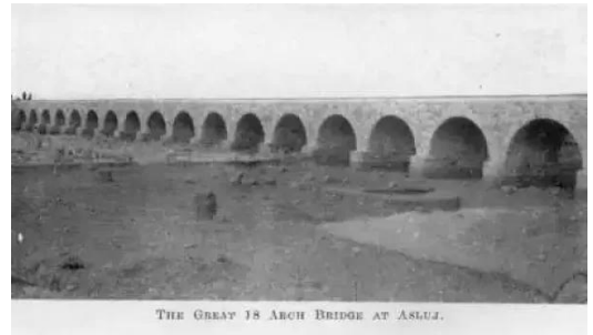
عسلوج : جسر القطار - عسلوج THE GREAT 18 ARCH BRIDGE AT ASLUJ.