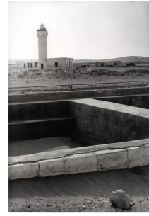
عسلوج : مسجد عسلوج قبل تدميره من قبل الجنود الاسرائيليين تم تفجيريه على يد موشي ديان عام 1950