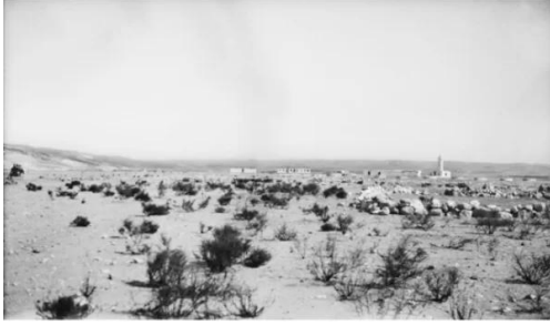
عسلوج : عسلوج سنة 1918