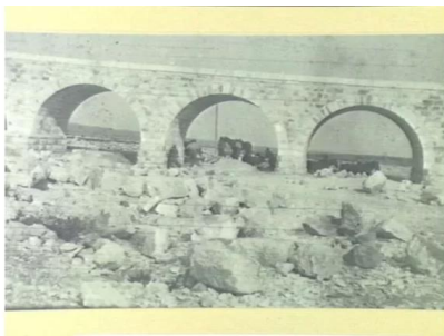
عسلوج : عسلوج سنه 1917