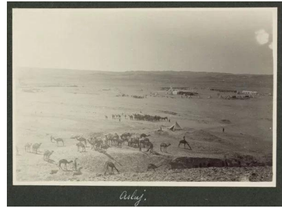
قرية عسلوج المهجرة قضاء بئر السبع