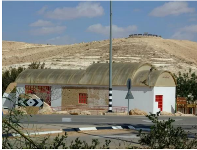
عسلوج : احد المباني التي تغطي احد الآبار