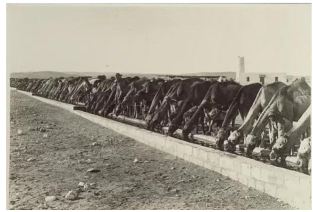
عسلوج : سقاية ابل الجيش العثماني في عسلوج 1916