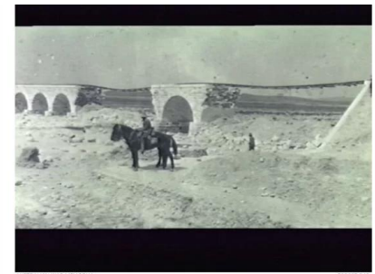
عسلوج : عسلوج سنه 1917