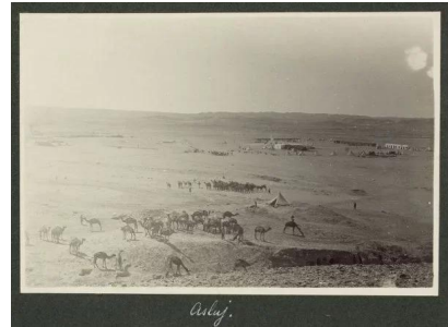
قرية عسلوج المهجرة قضاء بئر السبع