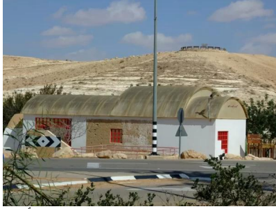
عسلوج : احد المباني التي تغطي احد الآبار