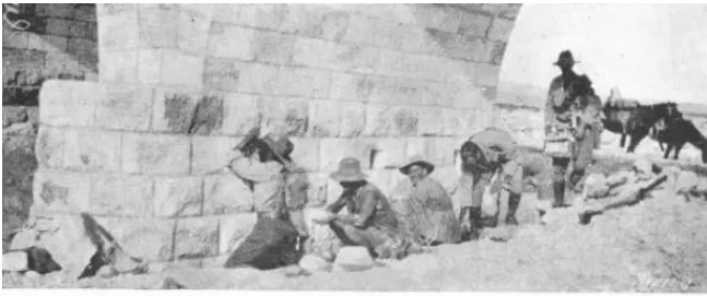
عسلوج : جسر عسلوج لحظة وضع الالفام PLACING THE CHARGES.