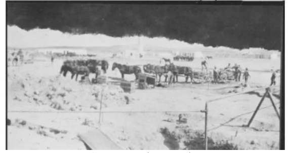
عسلوج : عسلوج سنة 1918