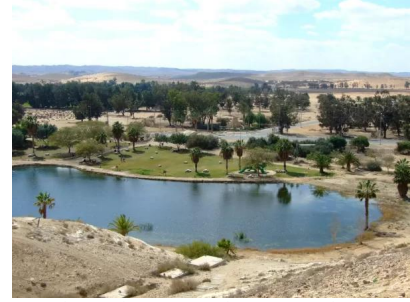
عسلوج : متنزه غولدى مائير على اراضي القرية المغتصبة ومركز القرية كان للامام بعد الشارع