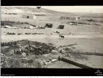
عسلوج : عسلوج 1916