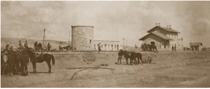
عسلوج : محطة القطار عسلوج