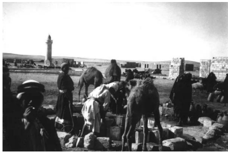
عسلوج : صوره نادره لعسلوج من سنه 1935