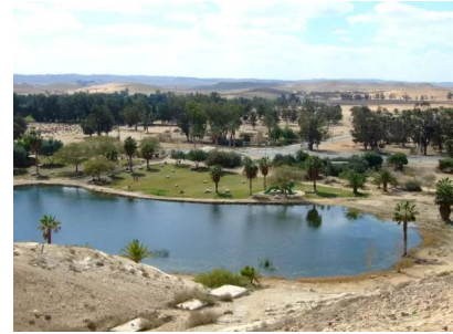
عسلوج : متنزه غولدى مائير على اراضي القرية المغتصبة ومركز القرية كان للامام بعد الشارع