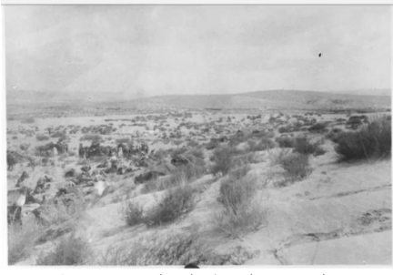
عسلوج : منظر عام لعسلوج سنة 1915