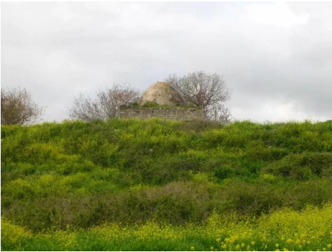
تريخا: مسجد تريخا لايزال صامد و ينتظر عودة اصحابه الاصلين