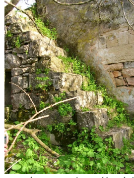
تريخا: مسجد تريخيا لايزال صامد ومنتظر عودة اصحابه الاصليين