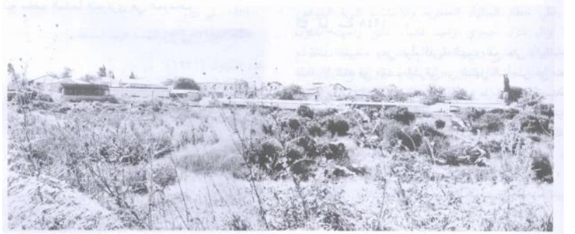
المشهد كما يبدو للناظر إليه من جهة الشرق (أيار/مايو ١٩٩٠) [تريخا] تريخا: اراضي القرية المدمرة، أنقر الصورة لتكبيرها. 1990