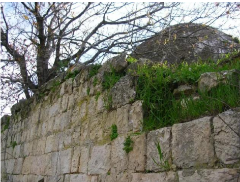
تريخا: مسجد تريخا لايزال صامد و ينتظر عودة اصحابه الاصلين