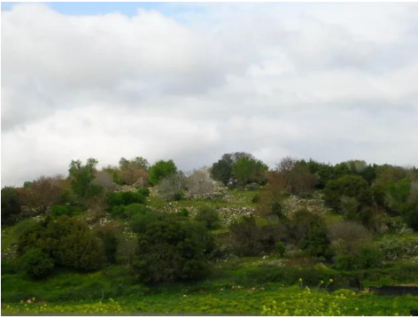
تريخا: اطلال البيوت التي هدمها الصهاينة