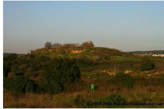
تريخا: موقع القرية 18.6.06