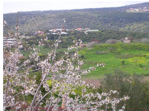
تريخا: مسجد تريخا لايزال صامد و ينتظر عودة اصحابه الاصلين