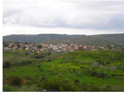
تريخا: مسجد تريخا لايزال صامد و ينتظر عودة اصحابه الاصلين