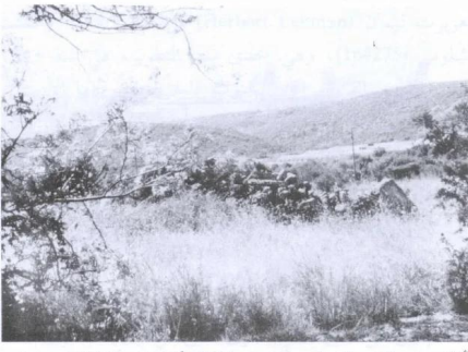
أفقا في الركن الشمالي من موقع القرية (أيار/مايو ١٩٩٠) [تريخا] تريخا: اطلال البيوت التي هدمها الصهاينة. 1990