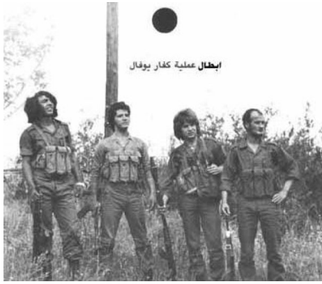
عملية كفار يوفال 1975 ( إبل القمح )

فيديو للجانزة الرمزية التي أقيمت يوم ١٩ حزيران ١٩٧٥ في بغداد لشهداء جبهة التحرير العربية الذين قاموا بتنفيذ عملية كفار يوفال