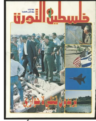
مجزرة حمام الشط | تونس في ١ أكتوبر ١٩٨٥ قصفت طائرات الاحتلال "الإسرائيلي" مقرات منظمة التحرير الفلسطينية في منطقة حمام الشط في تونس، وأدت الغارات، التي كانت تستهدف اغتيال أبو عمار وتدمير قيادة المنظمة، إلى استشهاد ٥٠ فلسطينياً و١٨ تونسياً وجرح العشرات.